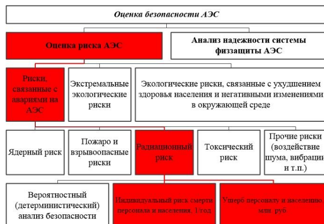
Рисунок 1 – Оценка безопасности АЭС

В данной работе рассмотрены, прежде всего, специфические для АЭС вопросы радиационной безопасности (рисунок 1).