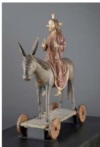
Christ des Rameaux , dernier quart du XVe siècle, Allemagne du sud, sculpture en tilleul, Paris, Musée national du Moyen Âge.

sculptures pour les processions se développe à partir des régions germaniques, où elles sont appelées « Palmesel » (âne des Rameaux). Une effigie du Christ est placée à califourchon sur l'âne, posé sur un chariot à roues ou un char. Au fil des siècles, cette tradition perd sa signification d'origine pour revêtir un caractère folklorique. Ainsi, contre rémunération, des enfants montent sur l'âne pour y faire un tour. Par conséquent, à partir du XVIII e siècle, la procession est interdite dans certaines régions.