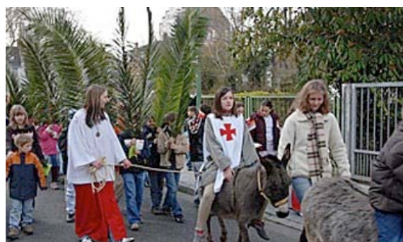
Procession des Rameaux , 9 avril 2006, jardin de la maison de soins infirmiers à Saint-Joseph Niederrad, Ralf Mack.

Au Moyen Âge, il était relativement fréquent de mettre en scène des épisodes bibliques. Le but de ces « pièces de théâtre » était de rendre accessible, à tous, les épisodes importants de la liturgie, étant donné que la majorité de la population était analphabète.