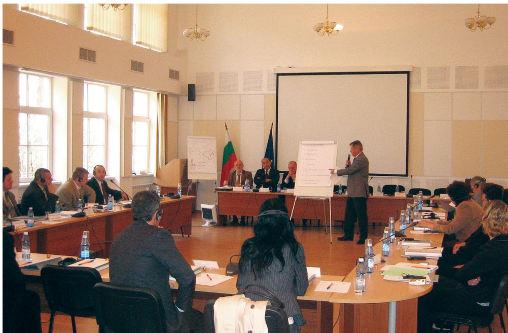
Семинар „Обучение на обучители по Наказателно-процесуалния кодекс“ (април 2006 г.)

Seminar „Train-the-trainer on the Penal Procedure Code“ (April 2006)