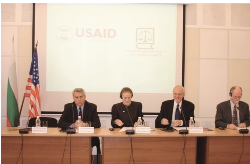
Посещение на г-жа Хенриета Фор – заместник държавен секретар на САЩ Mrs. Henrieta For – US Deputy Secretary of State