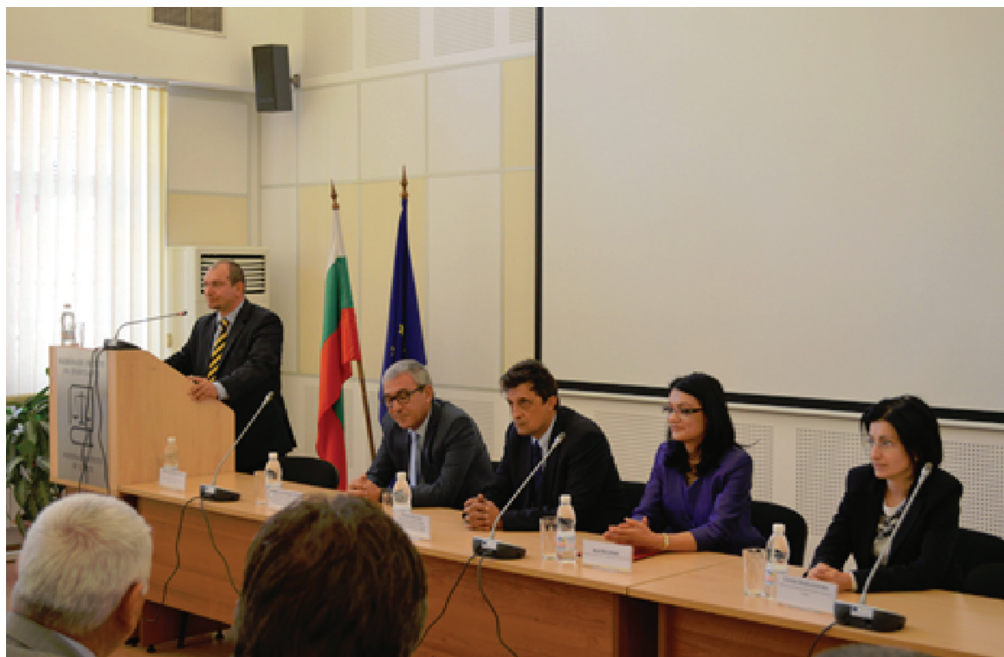
Откриване в Националния институт на правосъдието на новата учебна година на деветия випуск кандидати за младши съдии и младши прокурори (23 септември 2013 г.)

Opening of the school year for the candidates for junior judges and junior prosecutors at the National Institute of Justice (September 23, 2013)