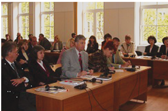
Обучение на прокурори-наставници (декември 2006 г.)

Training of mentor-prosecutors (Dec. 2006)