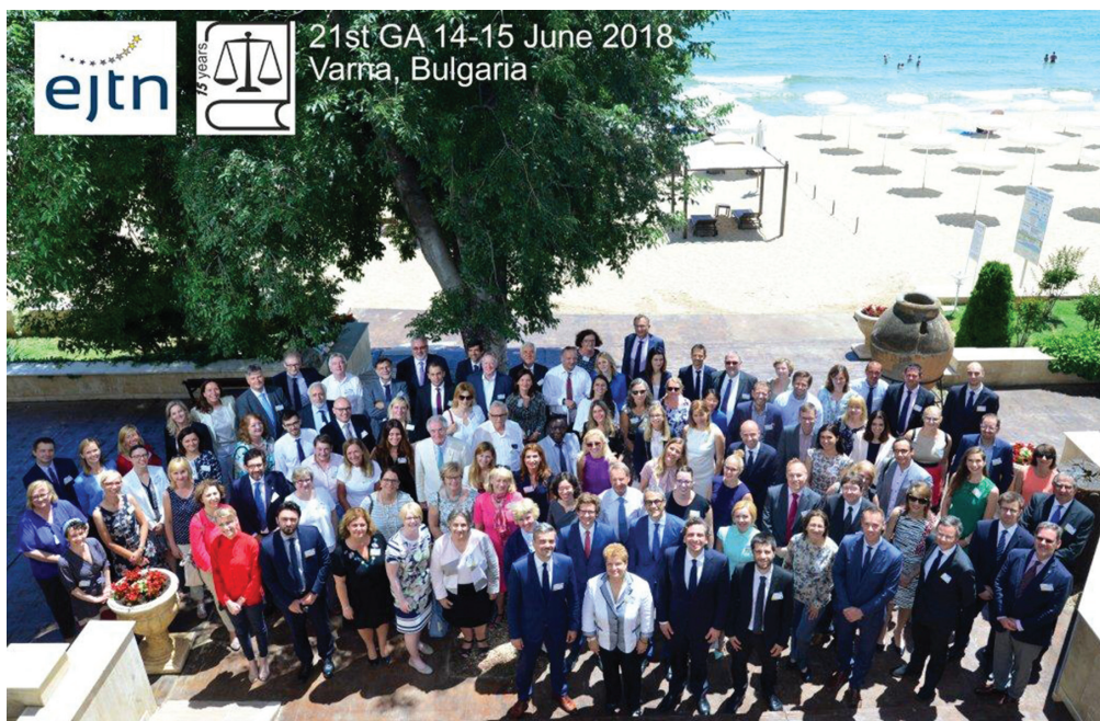
21-ото Общо събрание на Европейската мрежа за съдебно обучение, проведено във Варна на 14 и 15 юни 2018 г.