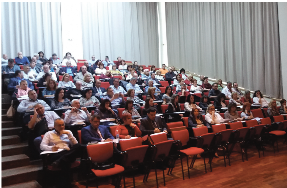
Обучения, осъществени по регионалната програма на НИП Regional trainings carried out by the NIJ