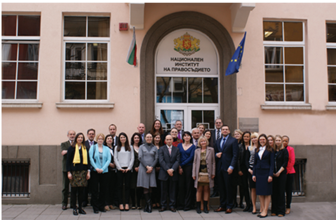
Националните представители на Програмата за обмен на Европейската мрежа за съдебно обучение провеждат годишната си среща в София, 25–27 март 2014 г.

National members of the European Judicial Training Network Exchange program on their annual meeting in Sofia on March 25–27, 2014