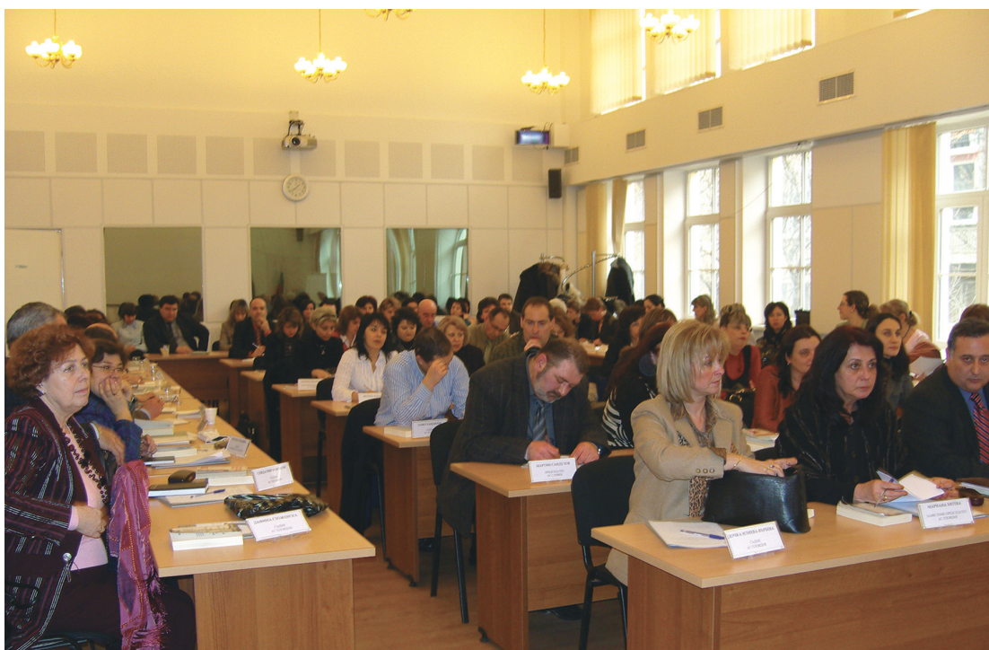
Обучение по новия Граждански процесуален кодекс, София, 2008

Training on the new Code of Civil Procedure, Sofia, 2008