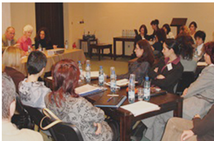
Обучение на съдии-наставници (декември 2006 г.)

The program and the guidance for mentor-judges were developed by the USAID Judicial Strengthening Initiative (JSI) and further developed by the European partners of the Institute. The NIJ's training program for mentor-magistrates includes the organization of special trainings and regional annual meetings, coordination of their activities and provision of