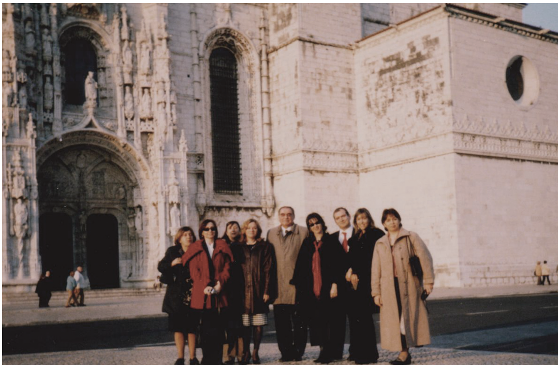
Представители на Националния институт на правосъдието на посещение в Центъра за правно обучение – Лисабон, Португалия (17 ноември 2004 г.)

With the support of the Norwegian Financial Mechanism and with the participation of in-