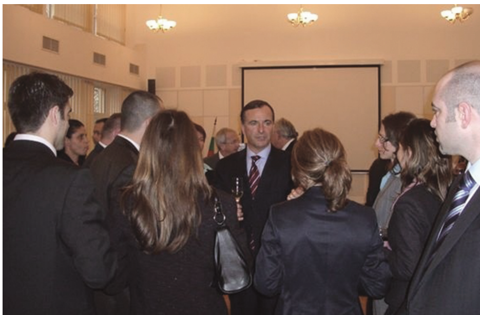
Публична лекция на г-н Франко Фратини – заместник-председател на Европейската комисия и комисар по въпросите на свобода, правосъдие и сигурност (16 февруари 2007 г.)