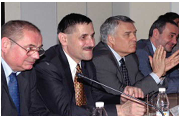
Официално завършване на курса за начално обучение, випуск 2006 (юли 2006 г.)

Graduation of the compulsory initial training class of 2006 (July 2006)