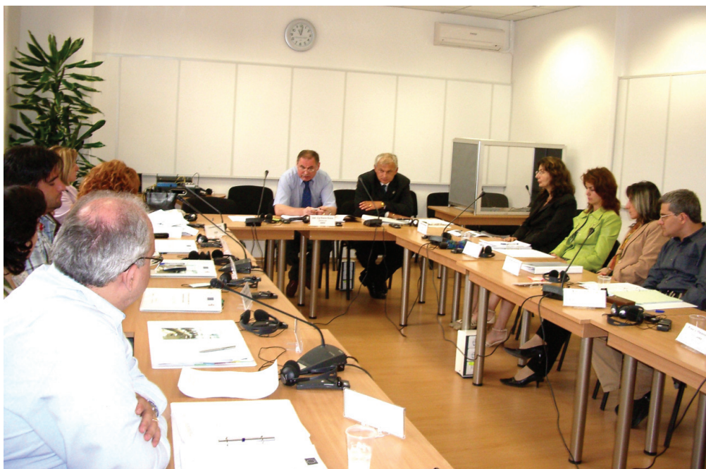
Годишна среща на преподавателите по европейско право (2005 г.)

Annual Meeting of the trainers on European Law (2005)