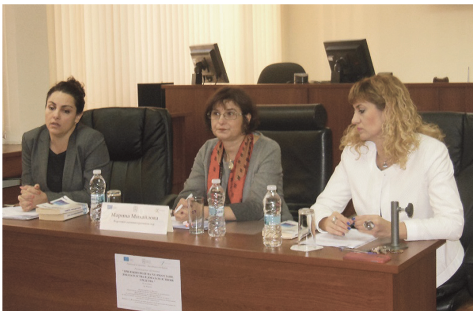
Регионални обучения на съдии по актуални казуси от съдебната практика в Апелативния съд – Бургас. Институцията е партньор по проекта „Качествено професионално обучение за повишаване ефективността на правосъдието“