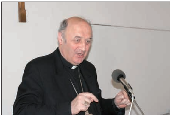
Snímek Vít Němec

Důležitá je nejen příprava organizační a programová, kterou má na starosti přípravná skupina, ale důležité je především to, co prožijeme ve farnostech. Pro kněze je připraven materiál k homiliím, katechezím a pobožnostem, které by nás jednou měsíčně měly doprovázet na cestě ke kongresu.