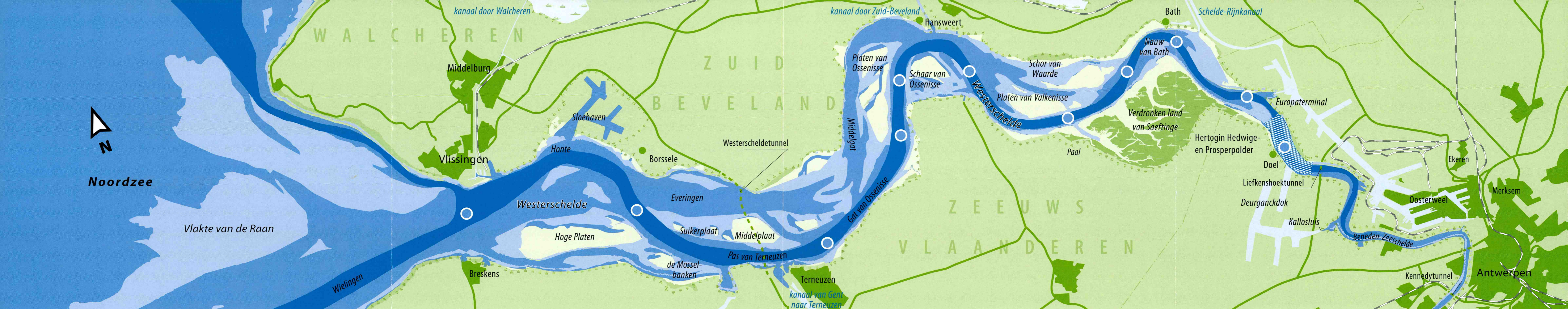
Overzichtskaart bij de Startnotitie / Kennisgeving Verruiming vaargeul Beneden-Zeeschelde en Westerschelde