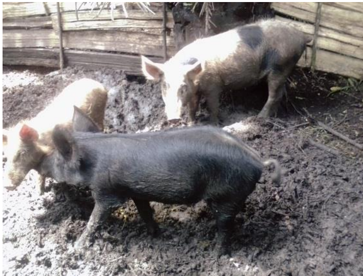
Porcherie APCBB à Buya Bokolongo