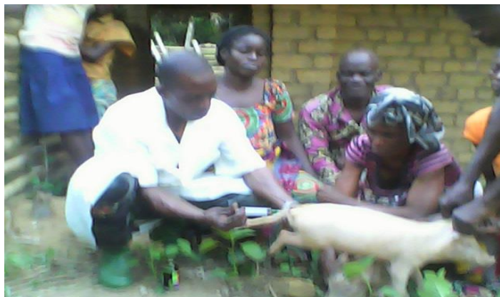
Cheptel des chèvres d'un membre de l'OP ACHABE/Bolomba