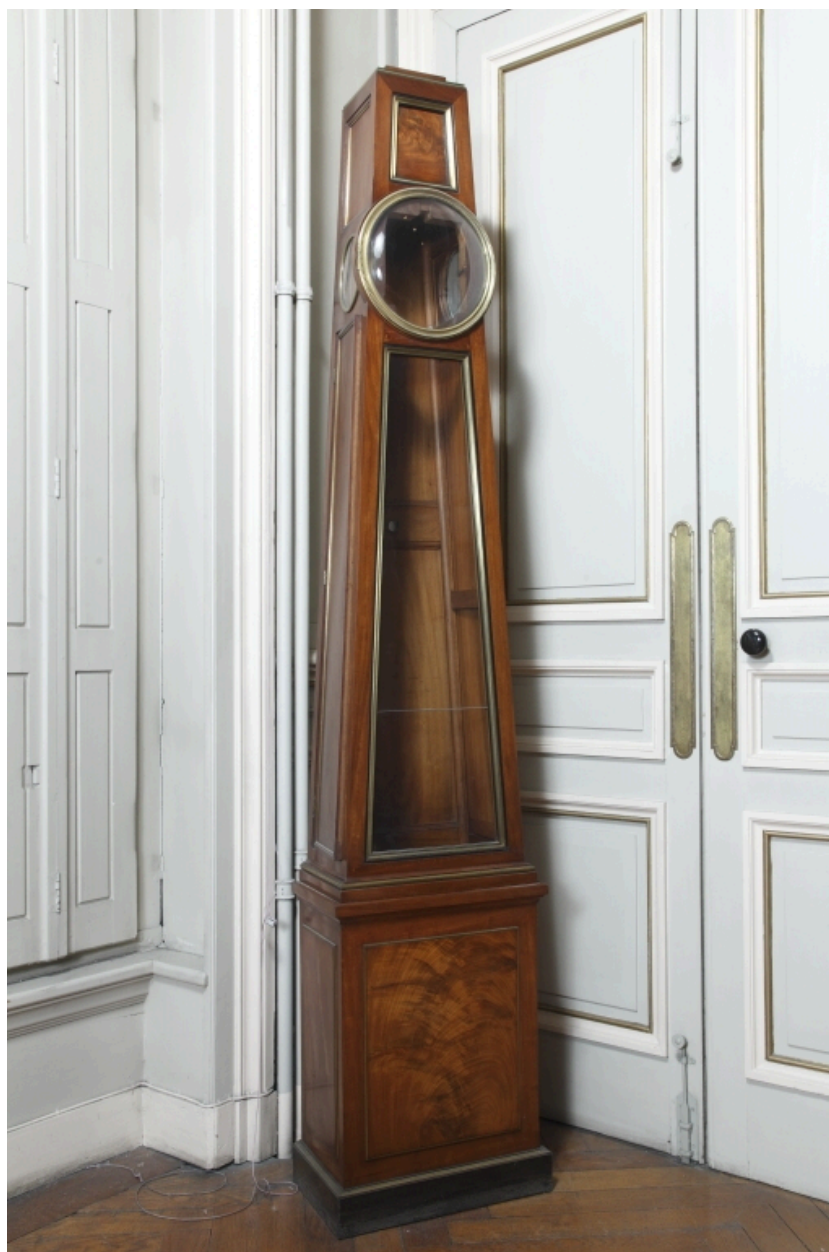
Vue générale sans le mécanisme