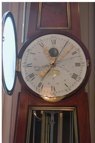
Vue rapprochée du cadran dans la boîte. IVR82_20116904225NUCA