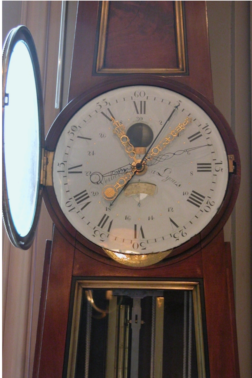
Vue rapprochée du cadran dans la boîte.