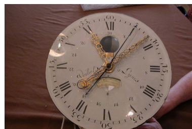
Détail du cadran. IVR82_20116904226NUCA