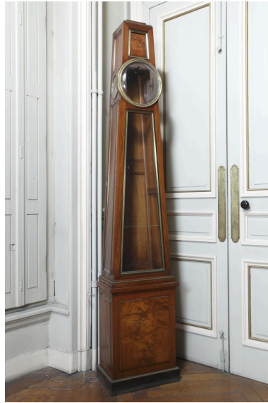
Vue générale sans le mécanisme IVR82_20106903943NUCA