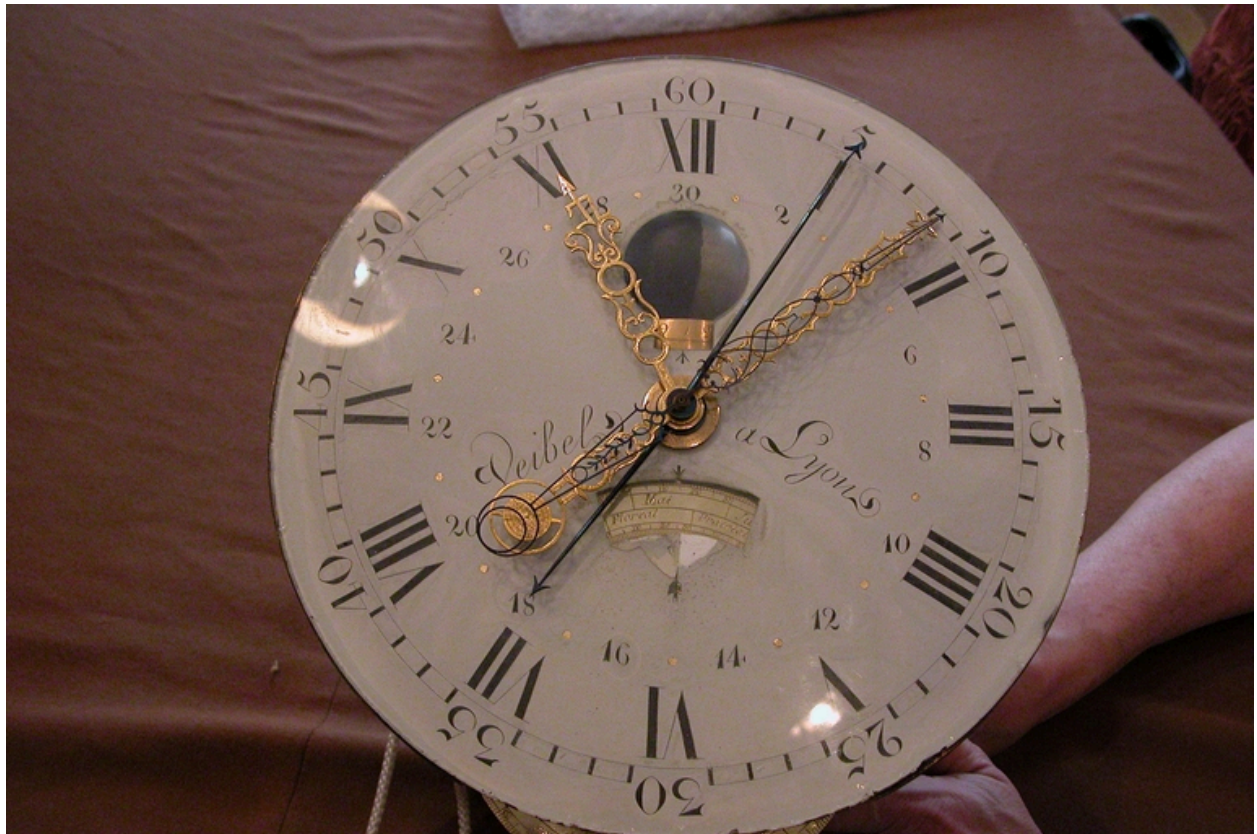
Détail du cadran.