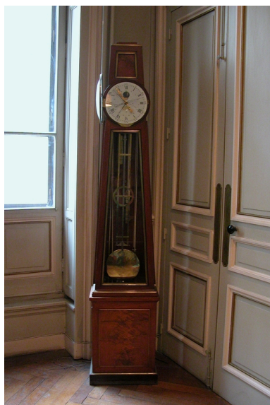
Vue générale IVR82_20116904224NUCA