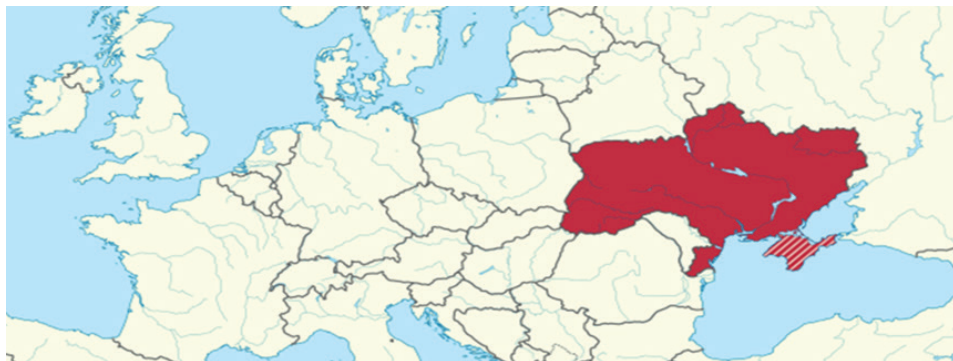
Rys. 1. Położenie Ukrainy na mapie Europy

jednoizbowy parlament – Najwyższa Rada Ukrainy (Верховна Рада України) – wybierany na pięcioletnią kadencję. Stolicą państwa i siedzibą władz najwyższych jest Kijów. Ukraina to członek wielu organizacji międzynarodowych, m.in. Organizacji Narodów Zjednoczonych, Wspólnoty Niepodległych Państw, Międzynarodowego Funduszu Walutowego, Organizacji Bezpieczeństwa i Współpracy w Europie, Rady Europy i Światowej Organizacji Handlu.