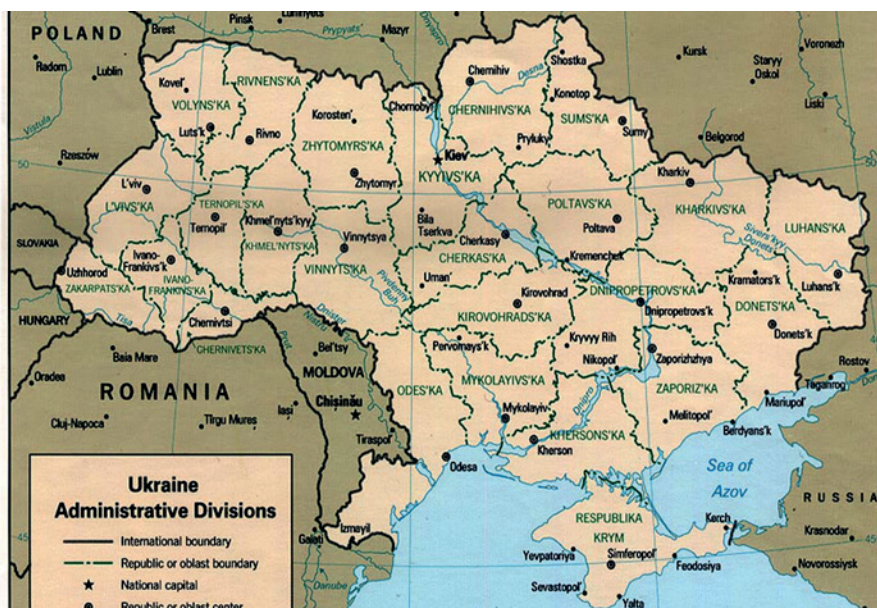
Rys. 2. Podział administracyjny Ukrainy

Źródło: http://pl.maps-of-europe.com/maps/maps-of-ukraine/administrative-map-of-ukraine . [dostęp: 7.04.2021]