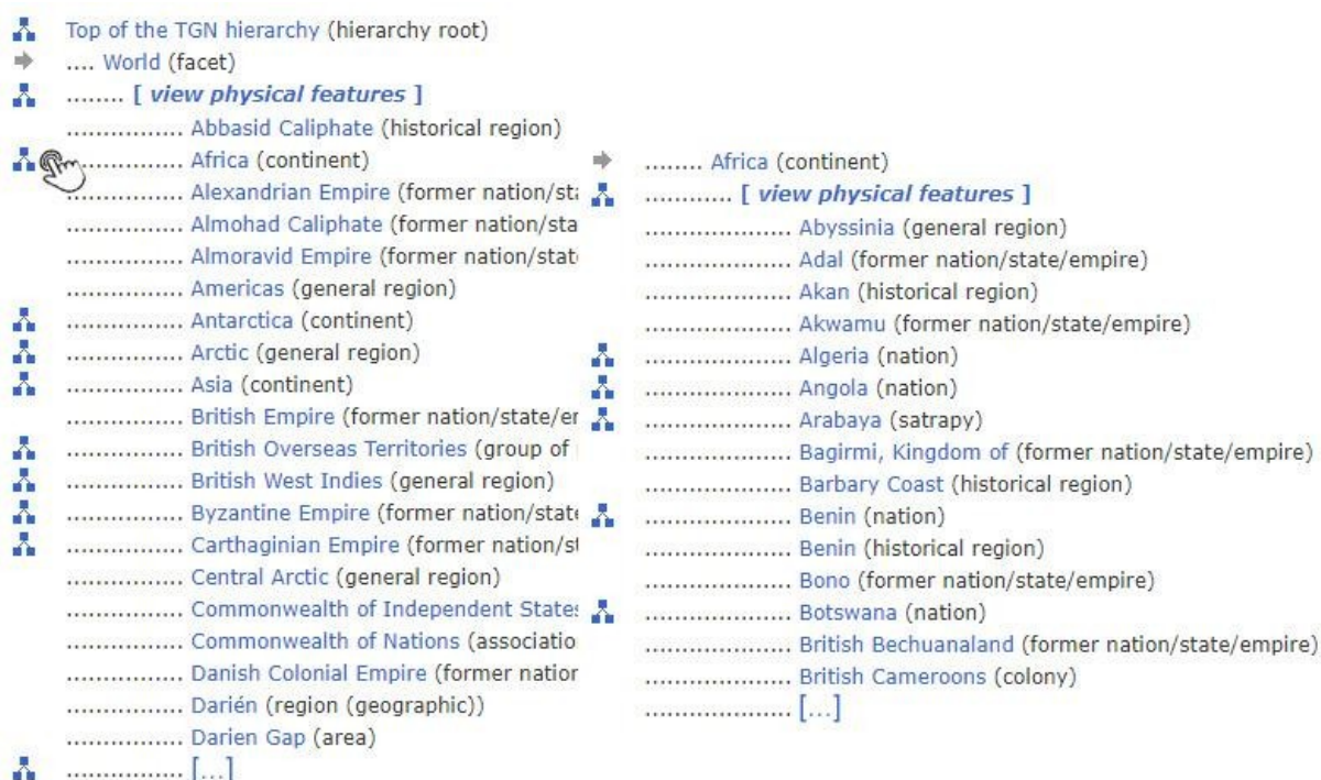
Figura 11. Hierarquia online do Tesouro de Nomes Geográficos

Fonte: Research Home (2018) 8 , adaptado