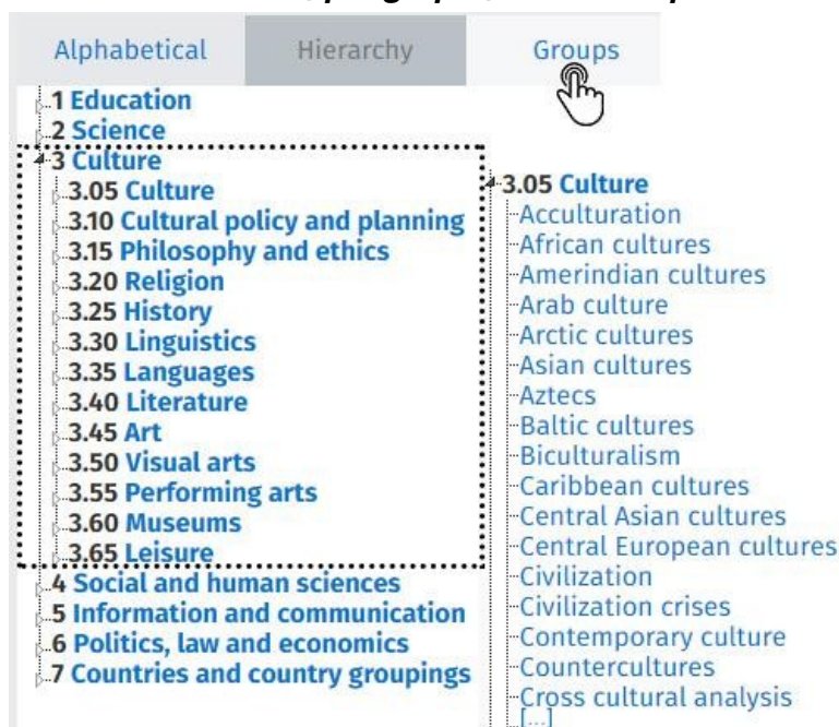
Figura 04. Tesouro da UNESCO, por grupos, com destaque a subárea Cultura

O Tesouro está subdividido em 7 grandes áreas: Educação; Ciência; Cultura; Ciências Sociais e Humanas; Comunicação e Informação; Políticas, Leis e Economia e Países e Grupos de Países, sendo cada área considerada um microtesouro. A Figura 04 apresenta esta subdivisão, além de um exemplo, com alguns itens da subárea Cultura.