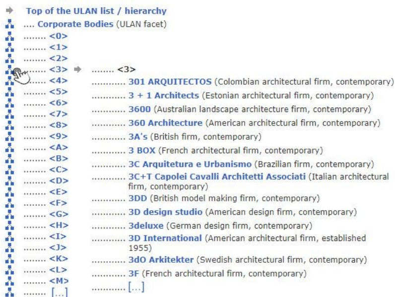
Figura 12. Hierarquia online do Tesouro de Nomes de Artistas