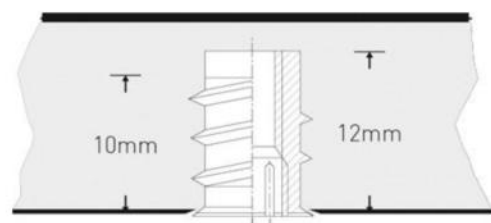
Befestigung mittels Gewindemuffe