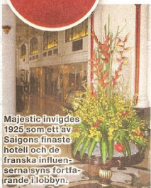
Majestic invigdes 1925 som ett av Saigons finaste hotell och de franska influenserna syns fortfarande i löbbyn.