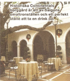
Historiska Continental's borggård är ett av Saigons smultronställen och ett perfekt ställe att ta en drink på.