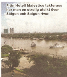
Från Hotel Majestics takterrass har man en otrolig utsikt över Saigon och Saigon river.