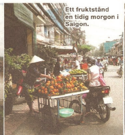
Ett fruktstånd en tidig morgon i Saigon.