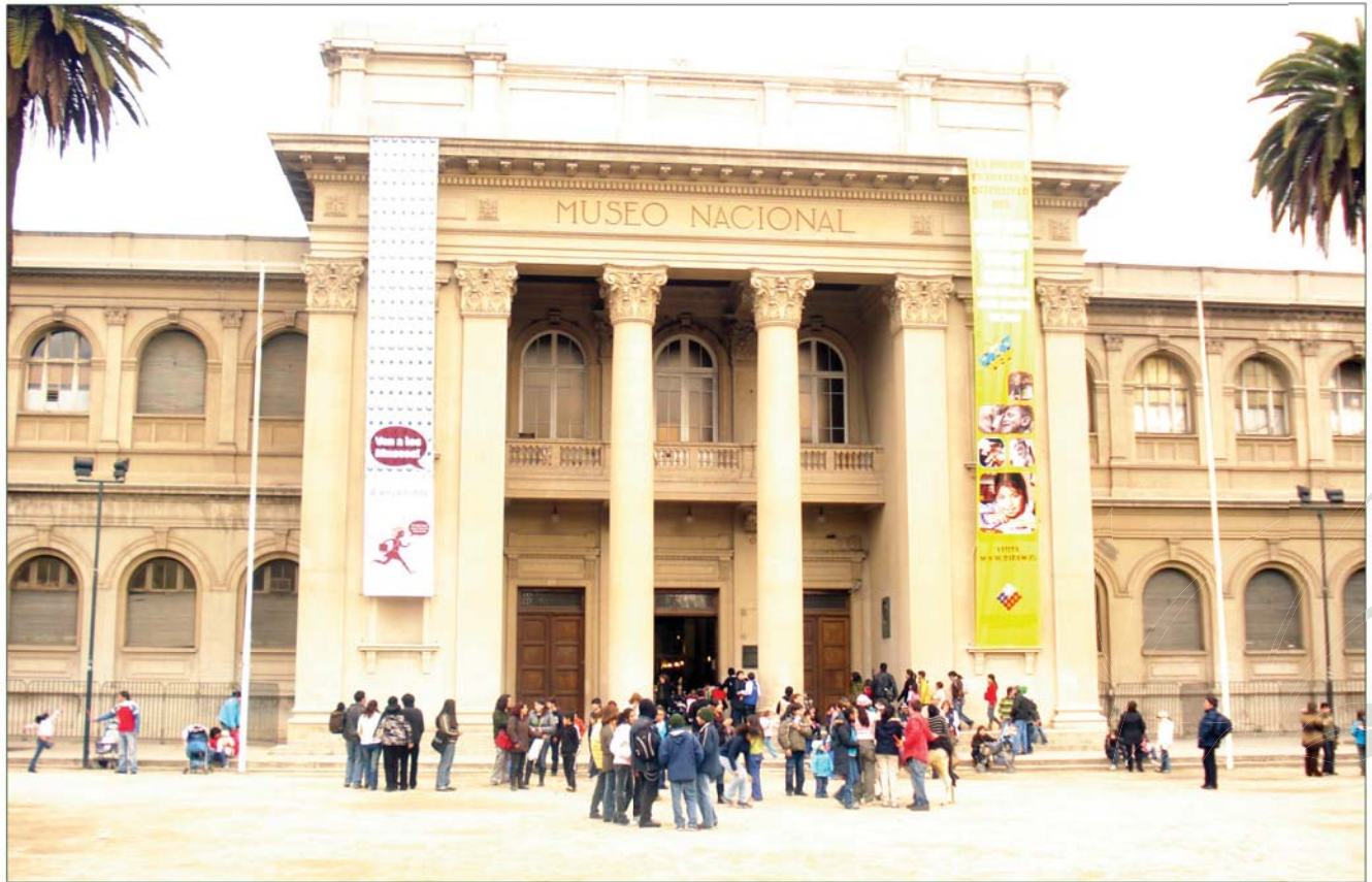
Pórtico del Museo Nacional de Historia Natural