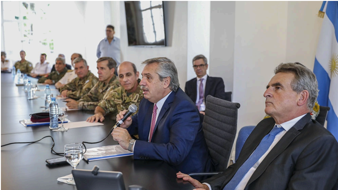
Imagen 1. El Presidente y el Ministro de Defensa con los Jefes de las FFAA al decretar el aislamiento social o “cuarentena”

Y si bien intentaré cubrir el panorama de distintos países, es difícil hacerlo en forma resumida, primero porque la dimensión y diversidad es muy amplia, segundo porque no todos los países han adoptado estrategias similares en la lucha contra esta pandemia y tercero porque sería demasiado extenso y aburrido. Voy a centrarme especialmente en la experiencia de la República Argentina, país que hasta el día 21 de junio de 2020 según las estadísticas de la Universidad John Hopkins- Coronavirus Resource Center 2 viene ocupando el lugar 32 en el mundo (41.204 infectados y 1000 muertos) y en Latino América el número 7 en la escala de países con mayor cantidad de personas infectadas y muertos. Es decir que representa -aproximadamente- un promedio entre los más y los menos afectados.