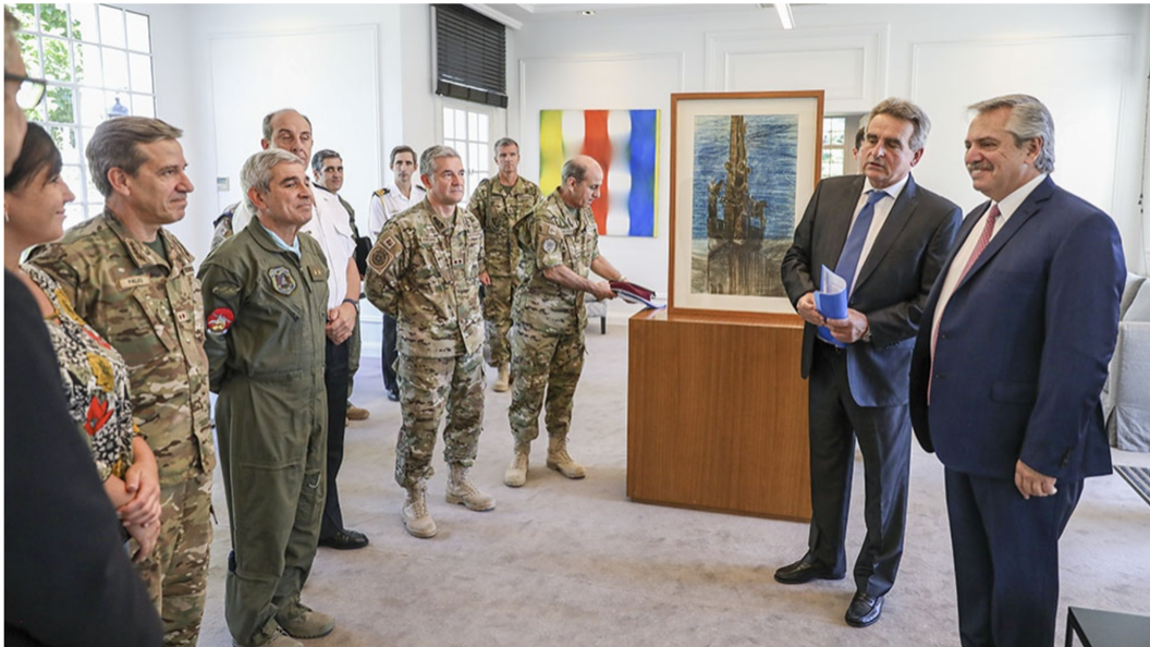
Imagen 5. El Presidente, en sus oficinas de la Residencia de Olivos, rodeado de los Jefes de las FFAA.

inmediata proporcionada por la Gendarmería Nacional o la Policía Federal o provincial correspondiente.