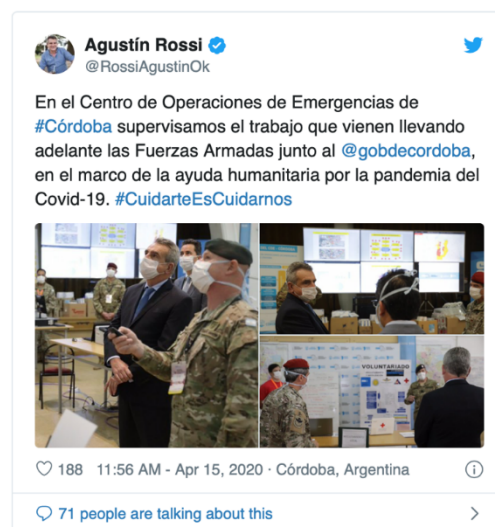
Imagen 4. Visita del Gobierno en el Centro de Operaciones de Emergencias de Córdoba.

Llegado a este punto, y dependiendo de la nacionalidad del lector, del grado de experiencia y conocimientos militares que cada uno tenga, podría parecer lógico y natural todo lo que se ha venido describiendo. Pero no es, no era, no fue así en el caso de la República Argentina de los últimos 30 años en donde renombrados periodistas, importantes funcionarios y mucha gente afín a numerosas autoridades se cuestionaban el porqué tener FFAA, muchos preguntando ¿para qué sirven las FFAA?, 11 mientras se miraba con poco interés como entraban en un proceso de desgaste y debilitamiento muy difícil de revertir.