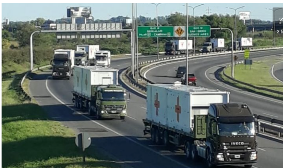
Imagen 3. Camiones del Ejército trasladan material de sanidad en uno de los accesos a la Ciudad de Buenos Aires.

Así fue como vimos, por todos lados y con una frecuencia inusitada para la Argentina, vehículos militares, personas de uniforme, imágenes reiteradas de equipo e instalaciones militares y una creciente presencia, real y digital, en todos los medios de prensa y de comunicación y, por supuesto, en las redes sociales, de anécdotas, historias y comentarios de lo que los militares estaban haciendo en tal o cual lugar. Y todo ello se repetía a lo largo y ancho de nuestro extenso país.