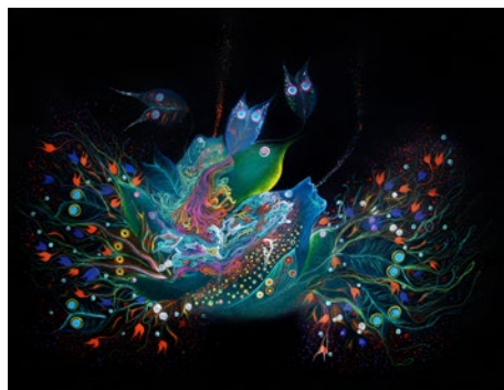
Peces de la quebrada