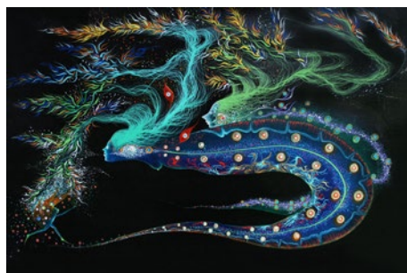
Hijas de la lluvia