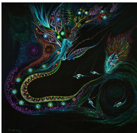
Nokokuriño dentro del río