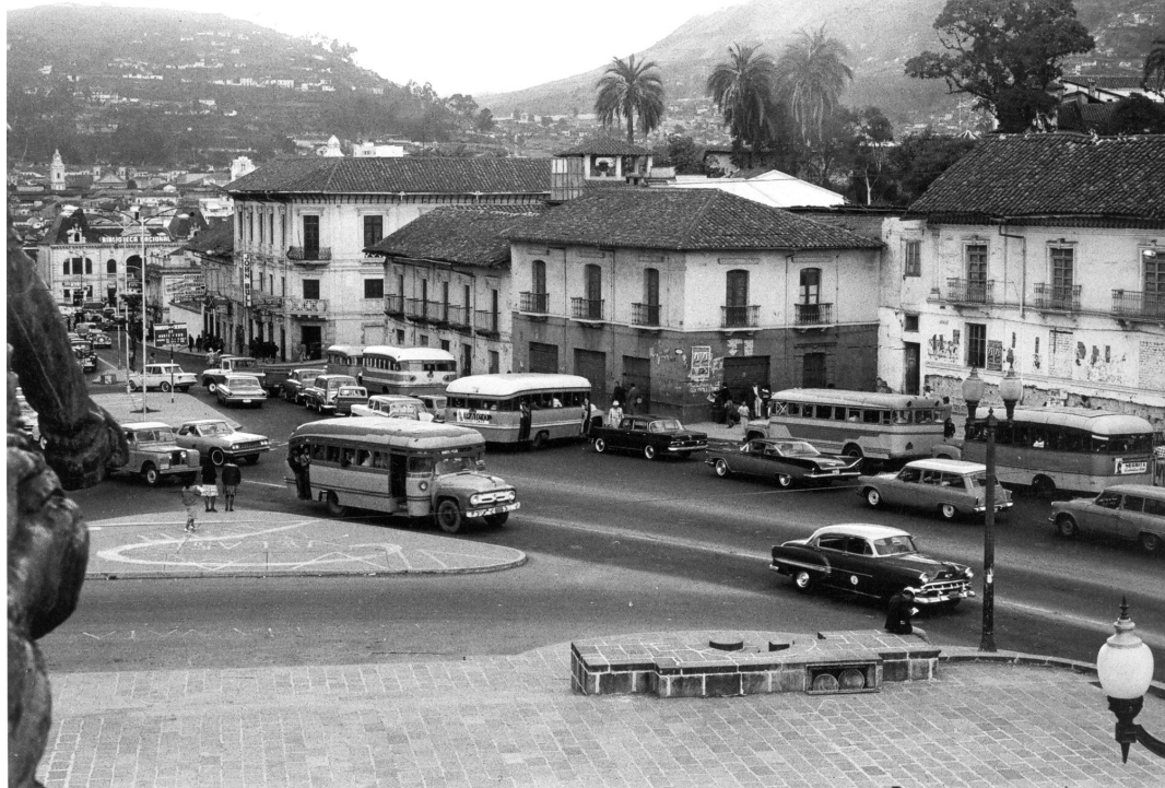
Foto 1. Sector La Alameda, calles Guayaquil y Briceño en 1964. En el fondo el edificio de la Biblioteca Nacional.

media y en forma continua hacia el norte". Se expuso por ello la siguiente alternativa: "Si tomamos en cuenta que la vía oriental tendrá vocación de tránsito pesado, el escogitamiento queda reducido a la remodelación de la calle Montúfar y a uno de los túneles". 54 De esta manera quedaba justificada la modificación de esa calle para el tránsito de transporte colectivo. Esta fue una de las medidas adoptadas con el fin de ampliar la "garganta", junto a la cual se planificó igualmente el ensanchamiento de la calle Guayaquil, entre Caldas y Briceño.