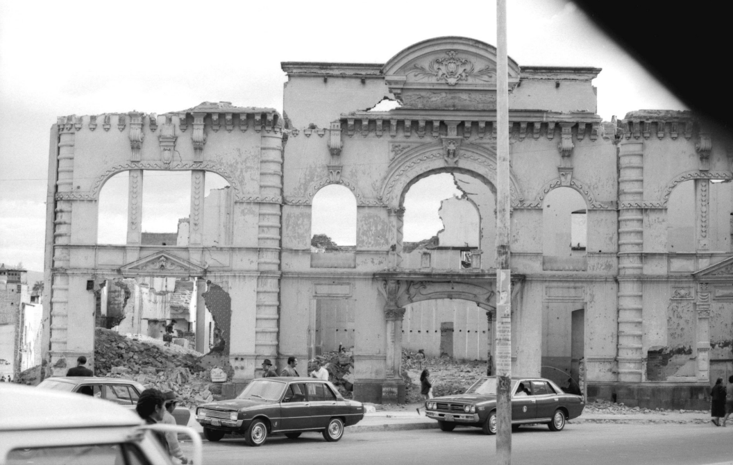
Foto 5. La Biblioteca Nacional en ruinas, aproximadamente 1974.

ró al otro lado de la plaza Bolívar, hacia la calle Gran Colombia, el edificio del banco La Filantrópica, popularmente conocido como “La Licuadora”. 65 Otras edificaciones en esta línea modernizadora son las que se levantaron en Santa Prisca; entre ellas, los edificios del Consejo Provincial, Benalcázar Mil y M. M. Jaramillo Arteaga.