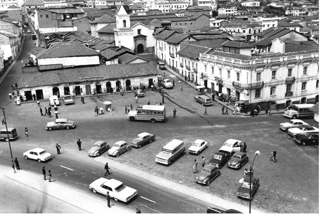
Foto 3. Plaza de San Blas, 1962. Al fondo el “mercado barato” en la Plaza España.