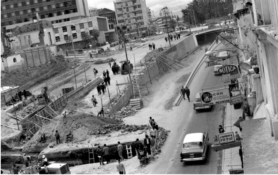
Foto 2. Nuevas vías, 1970. Construcción de un paso a desnivel entre San Blas y La Alameda.

visibilidad a la iglesia, se trasladó en 1970 el “Mercado Barato” a la plaza Arenas. 57 Estuvieron además la apertura de la calle Montúfar, así también el derrocamiento de casas para construir la avenida Pichincha con dirección a la plaza Marín y su relleno. En 1973 se inició la demolición del edificio de la Biblioteca Nacional.