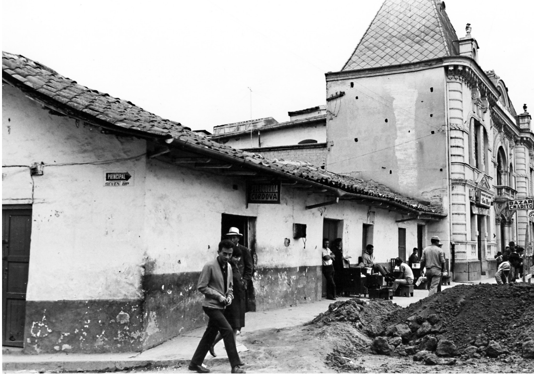
Foto 4. Biblioteca Nacional en San Blas, en 1969.

Resulta impactante la fotografía realizada por César Moreno en aquellos años, con la pared frontal del edificio en primer plano como única parte en pie entre las ruinas, como si fueran, efectivamente, los restos luego de un ataque (foto 5). Con su derrocamiento se echó abajo la inmensa importancia de contar con una Biblioteca Nacional representativa para una ciudad capital como Quito que, desde entonces, lo ha requerido.