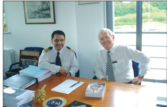
Fotografía N°2: Decano de Estudios Académicos del JSCSC, el Destacado Investigador y Estratega Marítimo, Profesor Geoffrey Till.

el DSD sostiene una extensa red de contactos y convenios de investigación con departamentos gubernamentales y organizaciones internacionales, cuyos logros han originado reconocimiento nacional, internacional y premios a su alto estándar de educación.