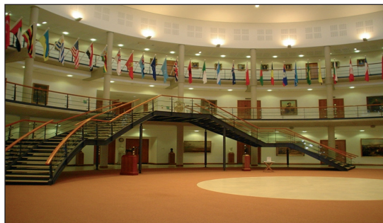
Fotografía N°1: Forum de Ingreso al JSCSC.

El ala de enseñanza del edificio principal posee 7 salas de conferencias, 67 salas de clases y las correspondientes oficinas para los miembros académicos y militares del staff. SERCO provee una red informática integrada y un sistema que brinda apoyo de oficina, circuito de TV, biblioteca y aplicaciones especiales de programas para juegos de guerra, comunicaciones para simulaciones tácticas, sistemas de gráficos, mapas, y diferentes requeri-