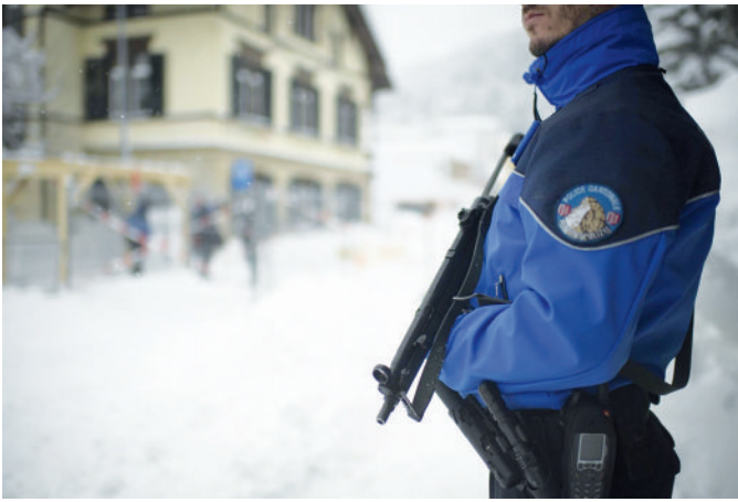
Le système concordataire (régional) et fédéral (IKAPOL) permettent l'engagement des polices cantonales au profit d'un canton - ici les Grisons, lors du Forum économique mondial de Davos.

menaces, face à la situation dans laquelle nous nous trouvons aujourd'hui, un discours clair, sans excès de pessimisme et de catastrophisme, sans envolées d'angélisme non plus ;