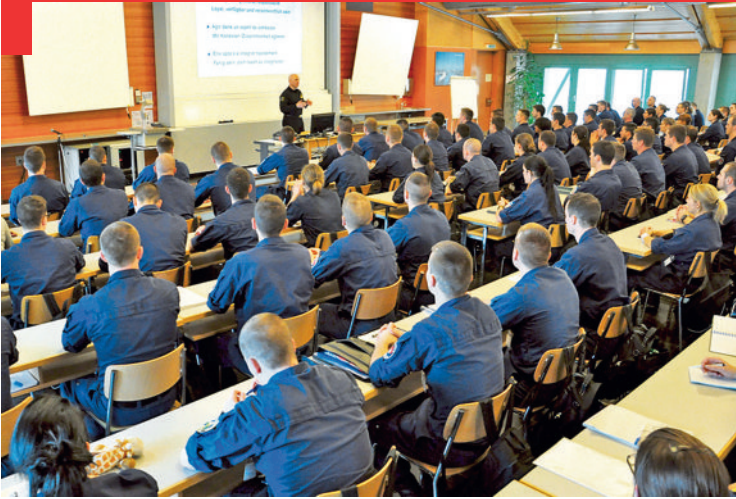
L'Académie de police de Savatan est responsable de la formation de base des policiers vaudois, valaisans et genevois.