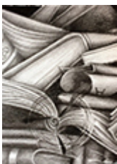
Ilustración de esta página: Langman, L. (2021). Pasó tiempo [grafito]. Programa de Cultura de la Secretaría de Extensión Universitaria de la Universidad Nacional de Quilmes, convocatoria artística “Imaginerías de una lucha”. Bernal: UNQ.

Lijalad, P. (2021). Lectura y escritura en la escuela: una forma desordenada de aprender a leer y a escribir. Sociales y Virtuales , 8(8). Recuperado de http://socialesyvirtuales.web.unq.edu.ar/articulos/lectura-y-escritura-en-la-escuela/