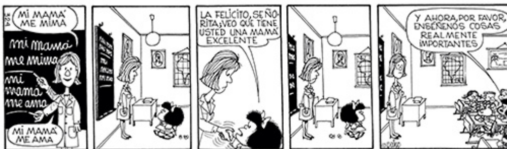
Quino (1996) y su mirada aguda sobre el sinsentido de estas prácticas tradicionales escolares. Clic en la imagen para ampliarla.

Particularmente, en la historia de la alfabetización se ha trabajado con metodologías reiterativas, mecánicas y carentes de sentido –¿qué sentido puede tener formar oraciones inentendibles como “Ulises ulula la ola”? (Kaufman, 1998)– que no solo han resultado poco motivadoras para los/as estudiantes, sino que, además, han mostrado carencias en cuanto al desarrollo de habilidades para construir y reconstruir el sentido de los textos.