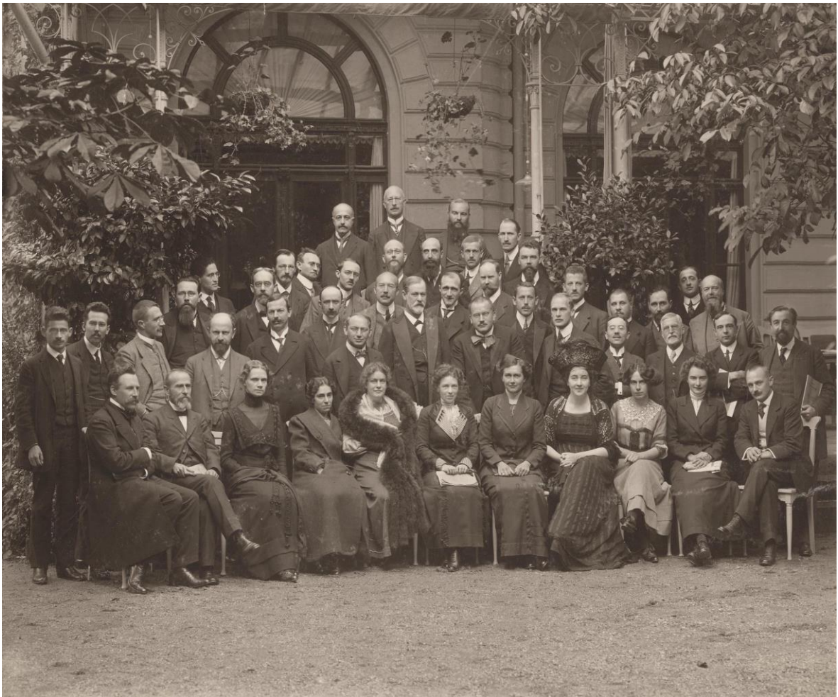
Congreso Internacional de Psicoanálisis celebrado en Weimar en septiembre de 1911.