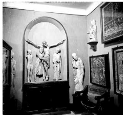
Fig. 7. Rincón de la casa museo Lluís Plandiura. 1926.

grafía– y la instaló en un edificio-museo en La Garriga. Plandiura llegó incluso a forjar una cuarta colección, la más íntima, constituida por dibujos –muchos de ellos dedicados– de los artistas presentes en su colección de arte moderno, que fue legada al Museo de Vilanova.