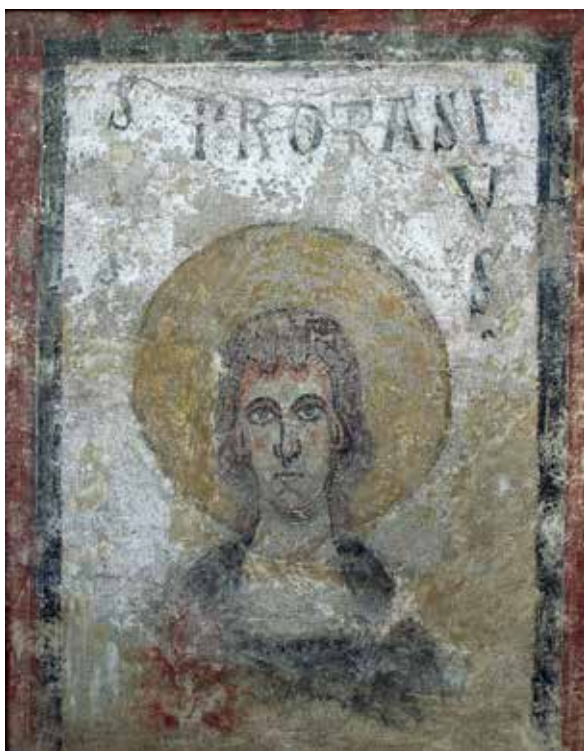
Fig. 10. San Protasio. Fragmento de pintura mural de la iglesia de Cap d'Aran. En 1950 en la colección Pratmarsó, hoy en una colección privada de Barcelona

El último servicio que Folch i Torres prestó al Museo de Arte fue la evaluación y selección de las obras de la colección Bosch i Catarineu que debían ser adquiridas por la Junta de Museos. Esta selección incluyó las pinturas murales del ábside de Sant Esteve de Andorra (Fig. 11). Éstas habían sido quizá adquiridas por el co-