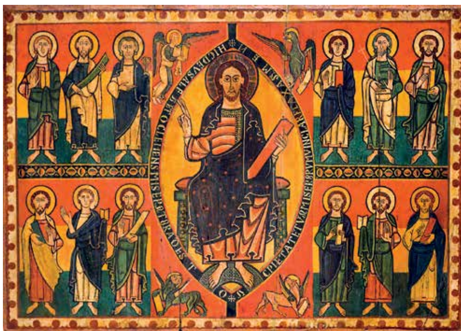
Fig. 8. Frontal de altar de Esquius