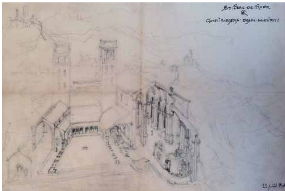
Fig. 3. Ll. Domenech i Montaner, Dibujo isométrico del monasterio de Sant Pere de Rodes, 11 de julio de 1905

mente nacional”, ni puede poseer un sistema constructivo u ornamental específico. Por eso la arquitectura moderna, la de finales del siglo XIX en su caso, “representará una civilización, pero no una región”. Se preguntaba qué medio debía considerarse nacional en España si el carácter plural español no se había formado con “una misma historia, ni una misma lengua, ni iguales leyes” 29 . Por eso juzgaba que en España había “dos tipos de arquitectura nacional”, superpuestas en algunos lugares. Años después, Domenech i Montaner ejerció una búsqueda particular de una “arquitectura nacional” en el pasado medieval, en aquel periodo encumbrado por la Renaixença . Con sus viajes y sus redescubrimientos del arte románico desplegado por el territorio catalán (1892-1905) –que debían desembocar en un libro que comenzó a redactar en 1901, pero que nunca llegó a publicar 30 – se generó un interés específico, y transversal, por el arte románico, por su arquitectura y su pintura (Fig. 3).