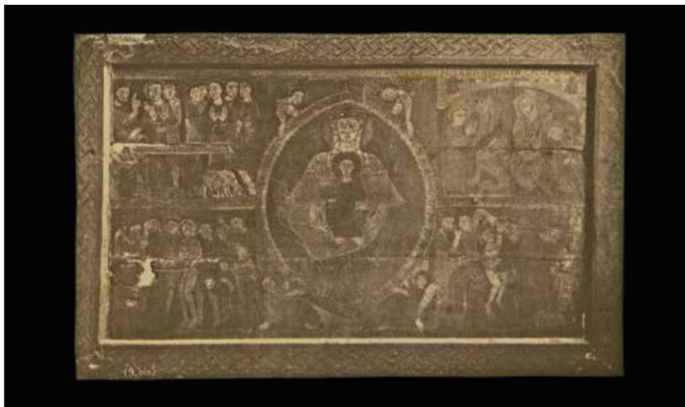
Fig. 1. Frontal de Santa Margarida de Vilaseca reproducido en el Álbum de la Exposición de 1877. Primera obra románica expuesta y reproducida en Cataluña, ya en la exposición de Vic de 1868. Museo Episcopal de Vic, 5. Segunda mitad del siglo XII

y catalogación. Por encima de estos propietarios y de otros gabinetes y colecciones privadas de la Barcelona del siglo XIX, descollaron las pinacotecas de Josep Carreras y la de Sebastià Pascual. En sus fondos, junto a pinturas flamencas o italianas, incluían de forma natural e incuestionable copias de obras reputadas de los siglos XV y XVI. Josep Carreras d'Argelich acaudaló más de 300 pinturas de firmas nacionales e internacionales de primer orden, grabados, monedas, objetos curiosos, animales disecados y una gran biblioteca con 14.000 volúmenes. Instaló su colección conocida como 'museo artístico' en el Palau de la Virreina y la abrió al público en 1835 12 . Por su parte, Sebastià Antón Pascual Inglada, industrial y académico de Bellas Artes, fue el primer coleccionista que dispuso su colección en un local adecuado para su exposición, con luz cenital, situado en la calle Xuclà 19, con pintura de escuelas española, italiana y flamenca 13 .