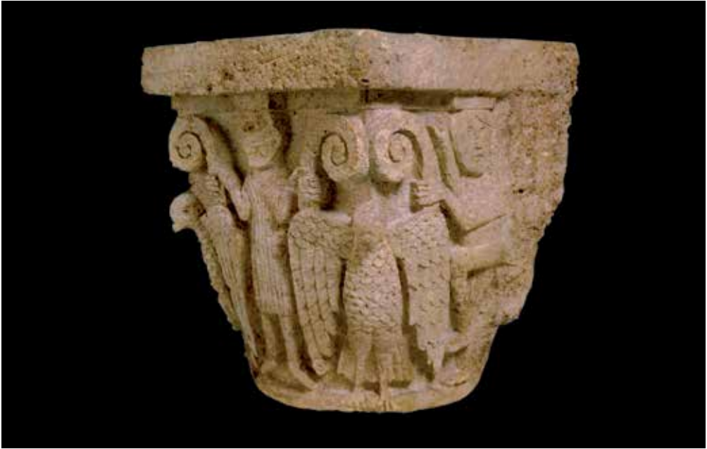
Fig. 12. Capitel de Santa María de Besalú