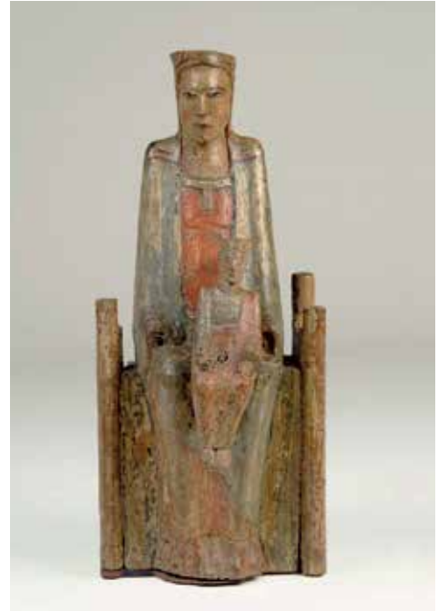
Fig. 13a-13b. Virgen con Niño. Colección 'El Conventet'. Izquierda: Cliché de Vicente Moreno, cuando la obra formaba parte de la colección Ignacio Martínez. Fototeca del Instituto de Patrimonio Histórico Español