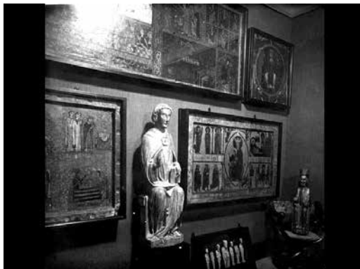
Fig. 6. Rincón de la casa museo Lluís Plandiura. 1926.