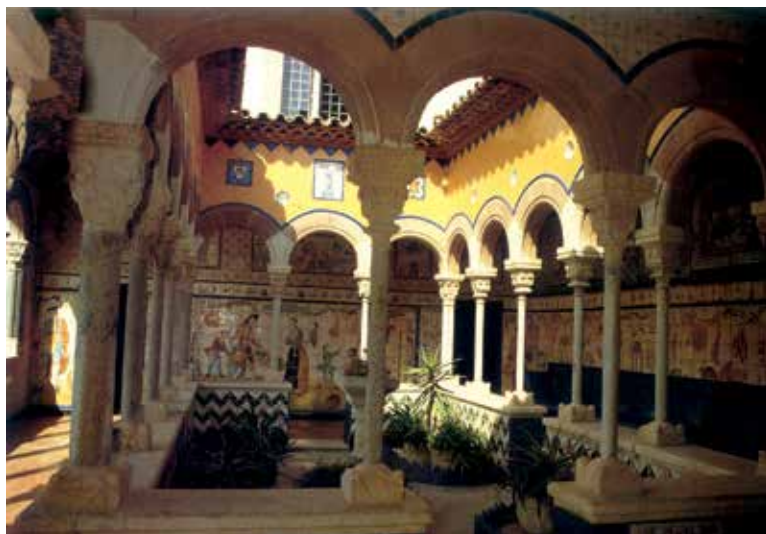
Fig. 5. Claustro escenográfico habilitado en el tercer piso del palacio de Maricel de Sitges

fueron fraguándose en los primeros lustros del siglo xx destaca la colección de Lluís Plandiura i Pou (1882-1956). Coleccionista de arte medieval y mecenas a través del grupo Les arts i els artistes , forjó dos colecciones a lo largo de su vida: la primera fue su colección de carteles publicitarios que recolectaba en las calles y a los que agregaba los obtenidos a través de la correspondencia con entidades internacionales. Cuando Plandiura contaba 19 años, el Cercle de Sant Lluç organizó una exposición de sus carteles extranjeros 43 . Dos años después, en 1903, el Real Círculo Artístico preparó una gran exposición de la colección completa de carteles, difundida mediante uno realizado por John Hassall. Plandiura vendió esta colección al Ayuntamiento de Barcelona por 3000 pesetas con la intención de dedicar los ingresos a adquirir nuevas obras de arte. Compró dos dibujos, uno de Galwey y otro -La monja- de Llimona, el artista del que adquirió su primera tela. En 1910, la revista Papitu ya hablaba de él, por cierto en unos términos muy crudos, como un coleccionista reputado y de su intención de legar la colección a la ciudad: