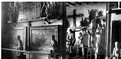
Fig. 2. Museu Episcopal de Vic. Fondos artísticos a principios del siglo XX. Descendimiento de Erill-la-Vall

Junto al Museo de Bellas Artes, fueron abriéndose los primeros museos eclesiásticos, surgidos en el seno de algunas sedes episcopales: Museo Episcopal de Vic (1891), Museo Diocesano de Lérida (1893) y Museo Diocesano de Solsona (1896). Las importantísimas colecciones de arte medieval y de artes decorativas reunidas aquellos primeros años se publicaron en 1893 a cargo de M. Gudiol en un catálogo razonado, considerado como el primer catálogo científico de un museo catalán. La constitución de los museos religiosos –engrosados en buena medida por fondos de arte medieval– (Fig. 2) 26 y del Museo Municipal, tuvo lugar en el marco de un amplio y transversal movimiento cultural, político e ideológico desarrollado en Cataluña en el último cuarto del siglo XIX, conocido como Renaixença . La perspectiva histórica que la Renaixença proyectaba sobre la Edad Media estaba caracterizada por la admiración y la nostalgia, al tiempo que manifestó la preocupación por la salvaguarda del patrimonio arqueológico y artístico de la Edad Media en y de Cataluña.