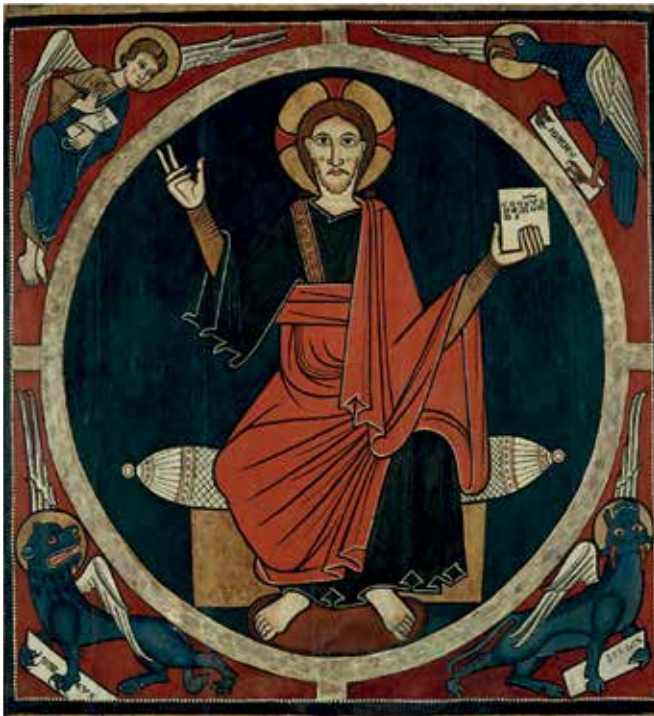
Fig. 9. Baldaquino de procedente de la iglesia de Sant Martí de Tost