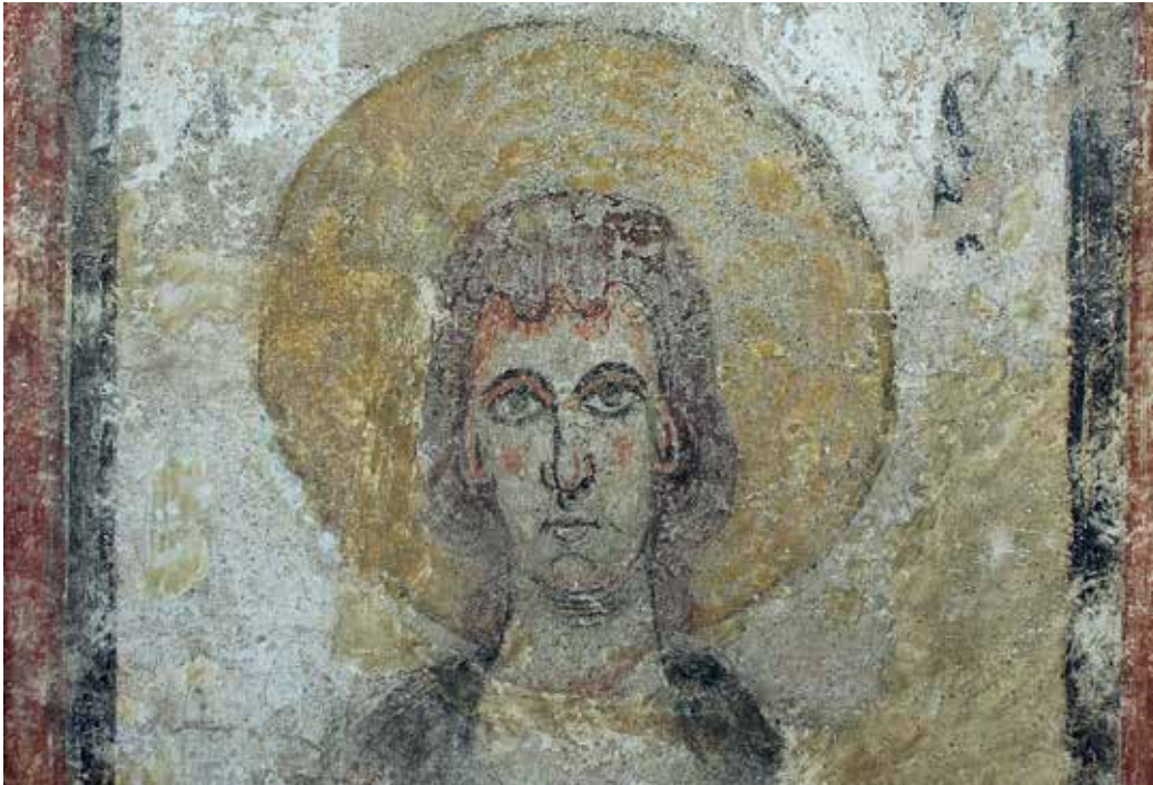
La diáspora del románico hispano. De la protección al expolio, Aguilar de Campoo, 2013