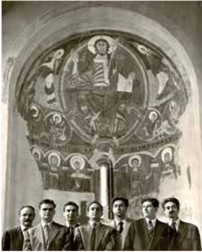
Fig. 14. Grupo de artistas Taüll, reunidos en el Museo de Arte de Cataluña, ante las pinturas de San Clemente.