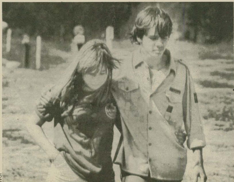
Molts joves s'aparellen sense tenir gens de coneixement dels perills de la promiscuïtat sexual

El 40 per cent dels qui van acudir a la consulta eren persones dedicades al comerç sexual, i un 60 per cent del total de pacients no presentava cap símptoma. Es van detectar 2.583 casos de MTS; entre aquestes, 217 sífilis i 242 gonorrees.