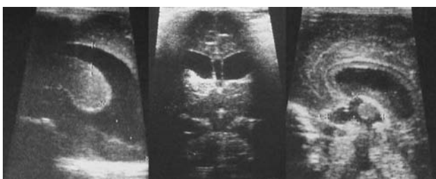
Figura 7. Neuroecografía vía transfontanelar. Cortes sagitales y coronales donde se muestra una dilatación ventricular por hidrocefalia.