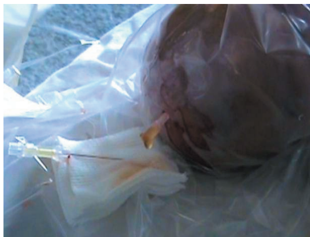
Figura 9. Líquido cefalorraquídeo purulento obtenido por punción transfontanelar.

índices de resistencia de las arterias cerebrales u otras estructuras (v.gr. detección de aneurisma de ampolla de Galeno, evaluación perioperatoria de la compliance intracraneana en una craneosinostosis) 3,8,21,37,38 . También resulta de utilidad en el período neonatal para el diagnóstico de: desórdenes metabólicos (v.gr. desórdenes en la fosforilación oxidativa, desórdenes en la biogénesis peroxisómica), y de hemorragias intracraneales y sus consecuencias 17,29 .