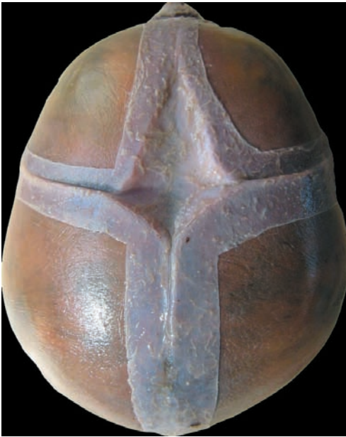
Figura 2. Vista craneal superior: fontanela anterior.