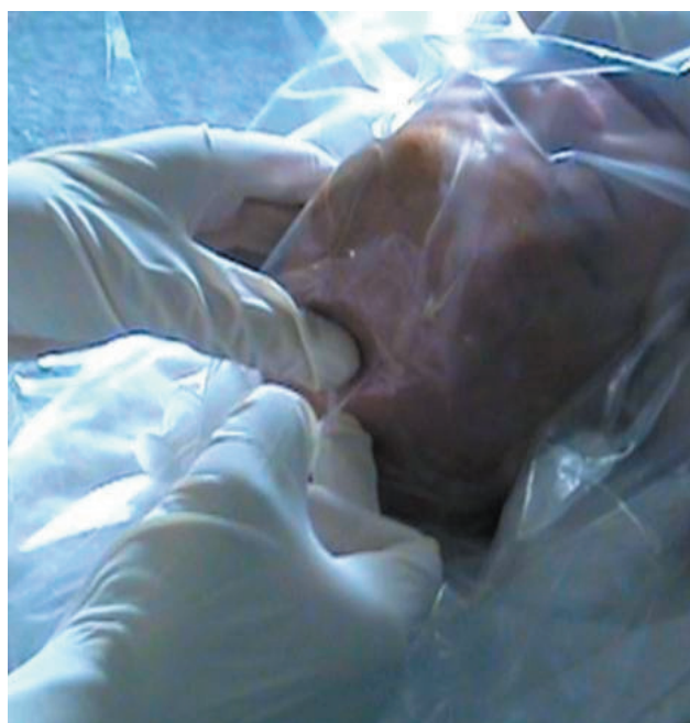
Figura 8. Técnica de punción transfontanelar (FA).

Puede además utilizarse la técnica de Doppler color, al momento de evaluar los vasos sanguíneos intracraneales,