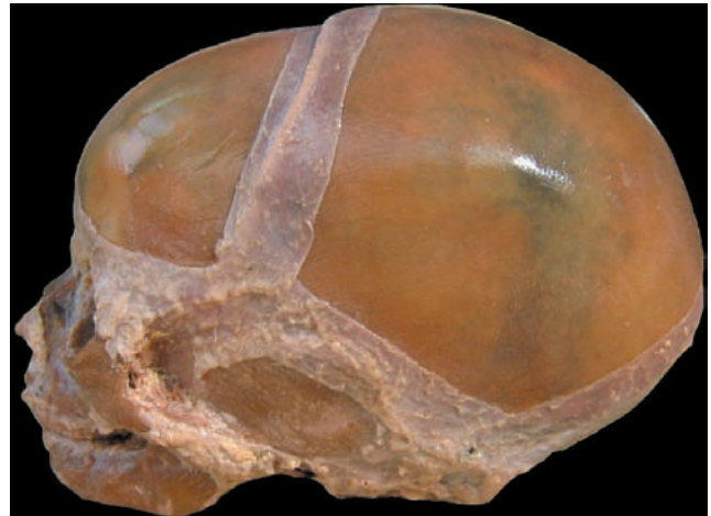
Figura 4. Vista craneal lateral: fontanelas antero y postero-lateral.