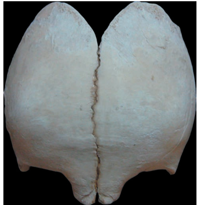
Figura 5. Vista anterior del hueso frontal: sutura metópica y parte anterior de fontanela anterior.

plo, hacia una deshidratación moderada o grave 16 .