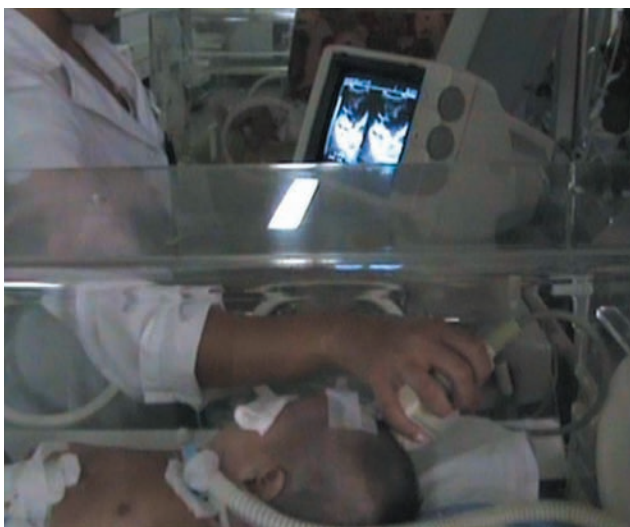
Figura 6. Realización de ecografía transfontanelar dentro de la incubadora.