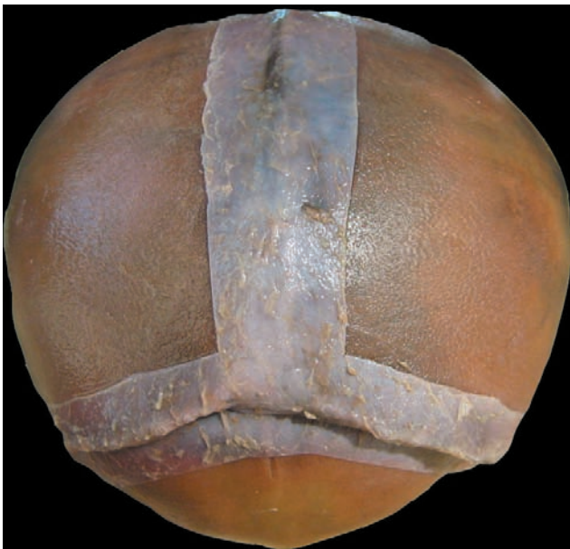
Figura 3. Vista craneal posterior: fontanela posterior.