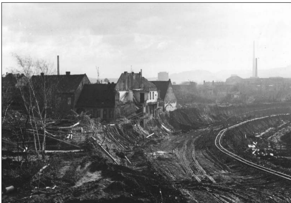
Porubní fronta postupuje. Někdejší Oblouková ulice v roce 1974

předpokládané nepřízni veřejného mínění – postavil za zachování kostela, s tím že „není přece možné přistupovat k záchraně této významné architektonické památky, která překonala věky, z hlediska dnešních našich obtíží“, a zároveň vyjádřil připravenost smysl nepopulárního opatření vysvětlovat pracujícím. 74 To se zřejmě nedařilo vždy, alespoň ne na celostátní úrovni, jak o tom svědčí ojediněle dochované protesty občanů. 75