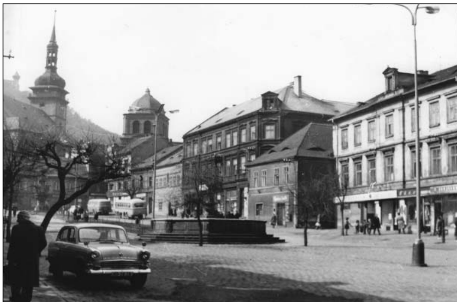
Mostecké II. náměstí při klášteře minoritů bylo po druhé světové válce přejmenováno na náměstí Ludvíka Svobody (nedatováno, šedesátá léta)

krajiny můžeme v nezávislejších periodikách zaznamenat nejpozději od roku 1958, 66 jazyk kritiky ničení kulturního dědictví jako by se teprve hledal. Na dílčí pokusy ze strany historiků či památkářů sice tu a tam narazíme, 67 tato kritika ale proráží do širěji sdíleného diskurzu výrazně pomaleji. A není bez zajímavosti, že pokud se v kontextu připravované likvidace starého Mostu přece jen objevuje, nikdy nepochází od samotných obyvatel města. Ti se sice kriticky vyjadřují k problémům nové výstavby, k nedostatku služeb a dalšího zázemí na sídlištích nebo o potížích s „cikány“ ve starém městě, samotný princip likvidace, těžby a budování nicméně není předmětem sporu.