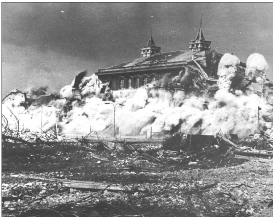
Hornický spolkový dům (Repre) v Mostě, postavený v letech 1921–1923, byl vyhozen do povětří 31. března 1980

a intelektuálních Literárních novin ) se o záchraně kostela až do roku 1968 psalo jen sporadicky a bylo znát, že národní výbory, vláda ani komunistická strana tuto záležitost nechtějí stavět na odív.