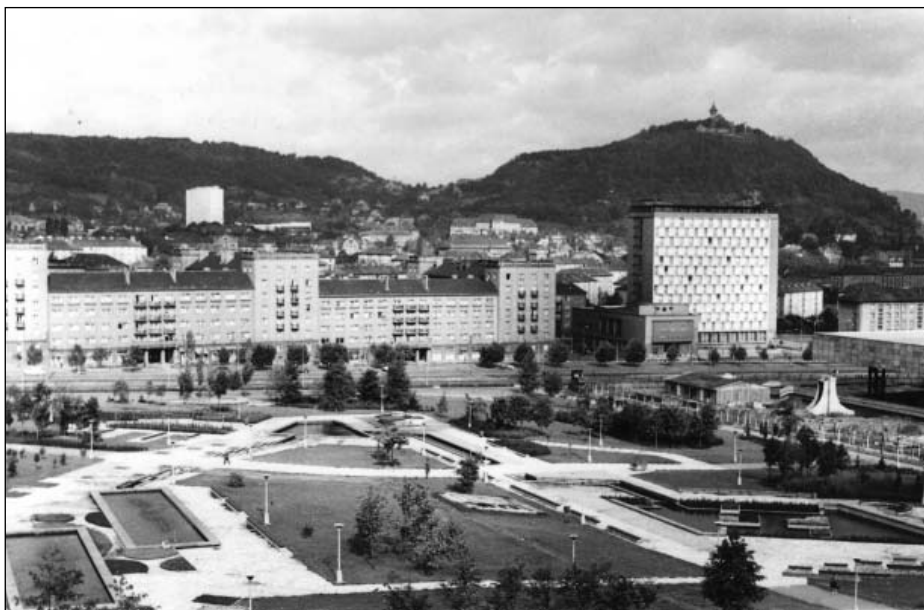
Parky a zeleň jako základní prvek moderního města. Fotografie ze sedmdesátých let nabízí pohled od Centrálního parku přes internát (vysoká panelová budova vpravo), stalingradskou čtvrť a vilovou čtvrť Zahražany na vrch Hněvín