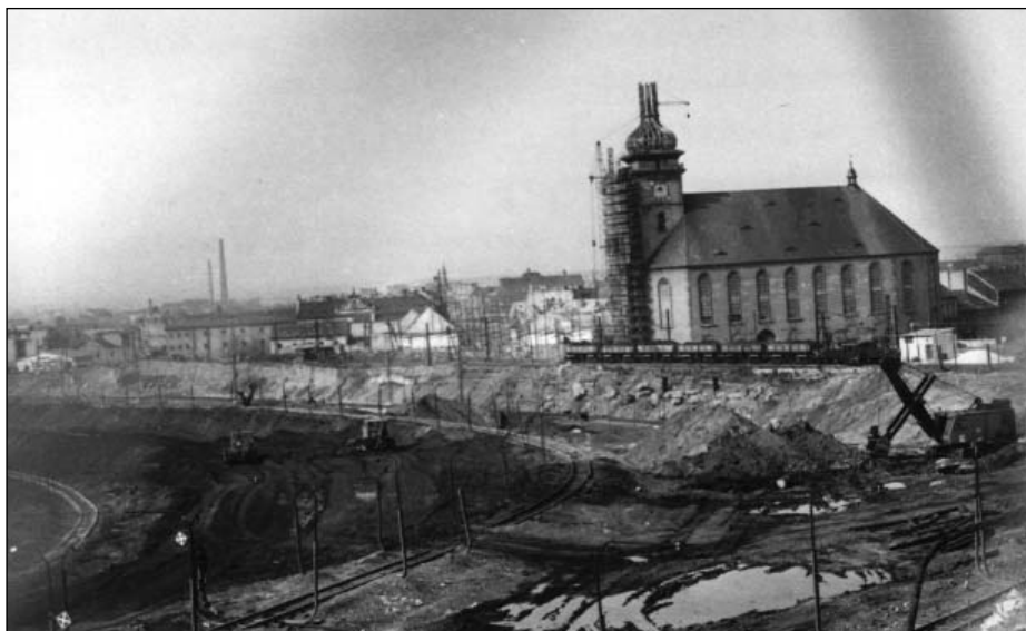
Odstrojování děkanského chrámu Nanebevzetí Panny Marie v březnu 1972, několik let před jeho stěhováním

šedesátých a sedmdesátých let se v celé Evropě z dříve expertního tématu ochrany historických památek stává diskurz vlastní výrazné (byť zřejmě stále ještě ne větší) části společnosti. Městské elity i střední vrstvy tou dobou začínají v západním Německu, Francii i Británii důrazně kritizovat modernistickou utopii racionálně uspořádaných měst i plošné bourání staré zástavby. Tento vývoj vrcholí v roce 1972 přijetím Mezinárodní úmluvy o ochraně kulturního dědictví. 76 Socialistické země tuto proměnu vztahu k dědictví minulosti reflektovaly a v podstatě kopírovaly. Sovětský svaz začal již koncem šedesátých let neutralizovat volání po zachování kulturního dědictví prostřednictvím konkrétních (zprvu značně selektivních) akcí, kdy například příslušné úřady vytipovaly skupinu výjimečně cenných pravoslavných kostelů, jež měly být chráněny před demolicí a restaurovány. V roce 1973 bylo historické centrum Moskvy rozděleno do devíti památkových zón, takže projekty typu hotelu Rossija v bezprostřední blízkosti Kremlu či rozparcelování arbatské čtvrtě od té doby již nebyly přípustné. Vývoj v socialistických zemích středovýchodní Evropy byl obdobný. Poté co zbourání kostela sv. Pavla v Lipsku v roce 1968 vyvolalo protesty obyvatel, začala se zásadně měnit i kulturní politika Německé demokratické republiky v oblasti architektury a urbanistiky, která se v sedmdesátých letech začala více než na internacionální modernu orientovat na pruskou tradici.