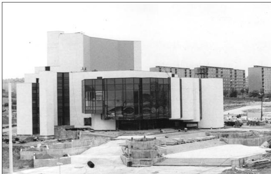
Právě dokončená budova nového divadla – chlouby nového Mostu – v roce 1985

dlouhá léta pouhým panelovým sídlištěm bez obchodů, škol a kulturního zázemí. Po celá šedesátá a sedmdesátá léta bylo hlavní ambicí všech zodpovědných institucí i jednotlivců skutečně realizovat vizi nového Mostu jako komplexního města a přenést do něj život, od každodenního nakupování až po letní koupání nebo večerní návštěvy divadla. Město a jeho tvůrci žádali a také postupně dokázali pro obyvatele naplnit všechny základní požadavky kladené na moderní společnost a spojované s důstojným životem – od lékařské péče (materializované v nejmodernější nemocnici tehdejší ČSSR) přes možnosti rekreace a sportovního vyžití (sít hřišť, atletický stadion, zimní stadion, koupaliště, park Šibeník), uspokojení konzumních tužeb (od běžných obchodů až po obchodní dům Prior, pyšníci se například eskalátory) po nabídku kulturní realizace (demonstrovanou jedním z nejmodernějších divadel v republice).