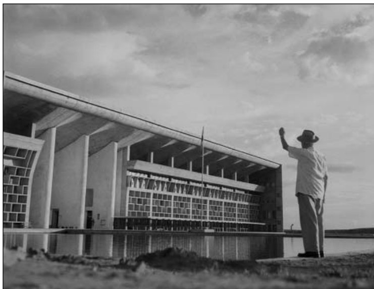
Fasáda budovy nejvyššího soudu indického svazového státu Paňdžáb v Čandígarhu i se svým slavným tvůrcem Le Corbusierem v roce 1956. Toto sídlo se narozdíl od Mostu dočkalo skutečného rozkvětu, dnes je považováno za centrum prosperity a nejčistší indické město

i z aktuálních západoevropských diskusí o funkcionalismu a konstruktivismu. 56 Komise složená z předních československých architektů všech generací nakonec vybrala projekt mladého ateliéru okolo architekta Václava Krejčího. Členové tohoto pracovního týmu čerpali z podnětů svých učitelů, aktérů meziválečné československé moderny, vymezovali se proti stalinskému socialistickému realismu a četli klíčové francouzské časopisy věnované architektuře a urbanismu. Sám Krejčí po letech vzpomínal, jak si s pomocí svých známých nechával posílat časopis L'architecture aujourd'hui , jehož pravidelná četba ovlivňovala jeho postoje a návrhy. 57 V projektu centra nového Mostu sice museli Krejčího spolupracovníci navazovat na „sorealisticke“ bloky sídliště Podžatecká, postavené během padesátých let, jinak ale mohli využít skvělé příležitosti – právě v dobách obnovované spolupráce se západoevropskými konstruktivisty a funkcionalisty a počínající masové produkce typizovaných domů – postavit celé zbrusu nové město.