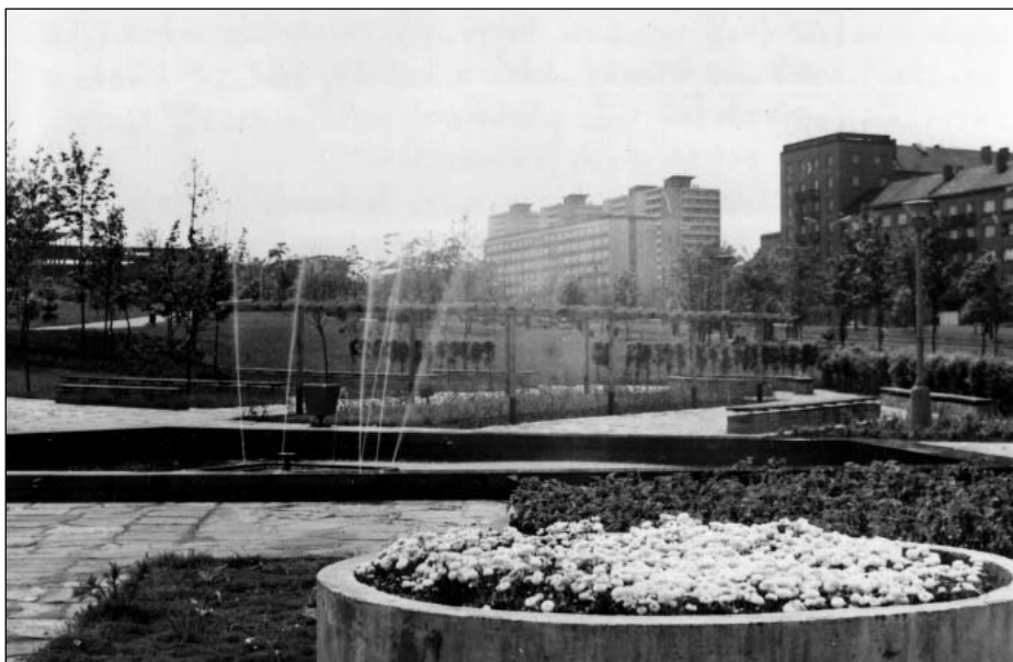
Město růží. Centrální park oddělující sídliště Podžatecká z padesátých let minulého století od středu nového Mostu z let šedesátých až osmdesátých (foto 1974)

Crawley, Hemel, Hempstead, Harlow nebo Hartfield) byla budována autokraticky, bez dialogu s obyvatelstvem, ale se silnou vírou, že z výsledku budou nakonec mít všichni prospěch. 46