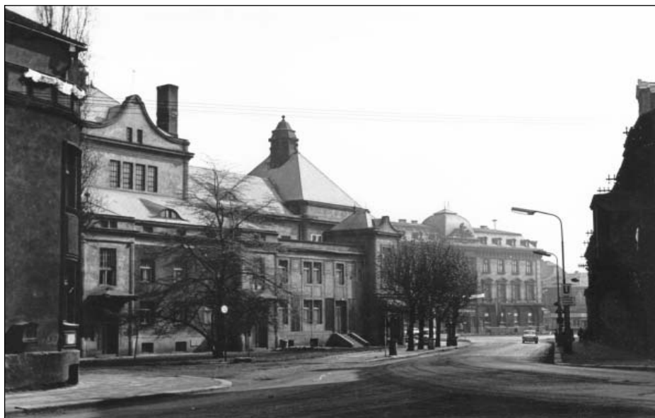
Slavné mostecké divadlo a budova spořitelny z konce 19. století ve starém Mostě v roce 1963, kdy ještě sloužily svému účelu

nyní mělo nahradit sociálně spravedlivé město poskytující pohodlné bydlení a vytvářející předpoklady pro skutečný pocit domova. Čisté zelené město otevírající desetitisícům lidí bránu k důstojnému životu mělo v praxi naplnit utopické vize předchozích generací. Obraz nového Mostu, jak byl vykreslován především v první polovině šedesátých let, tak v sobě propojoval utopické představy ideálního města s technokratickou představou státu, jenž díky racionálnímu způsobu plánování a technickým možnostem dokáže uspokojit veškeré potřeby každého člena společnosti.