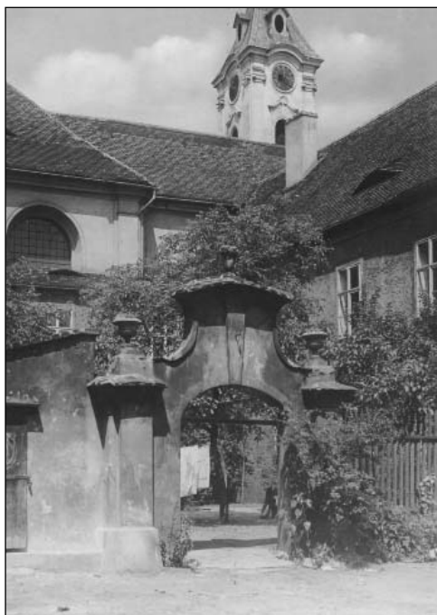
Bývalý barokní františkánský klášter (klášter minoritů) byl vedle děkanského chrámu jednou z nejvýznamnějších církevních staveb starého Mostu (foto nedatováno)

Manažerům Severočeských hnědohelných dolů a celé ekonomicko-technologické lobby začalo být jasné, že pro úspěch jejich snažení (tedy aby se dostali k milionům tun hnědého uhlí pod starým Mostem) bude nutné přijít s propracovanější strategií.