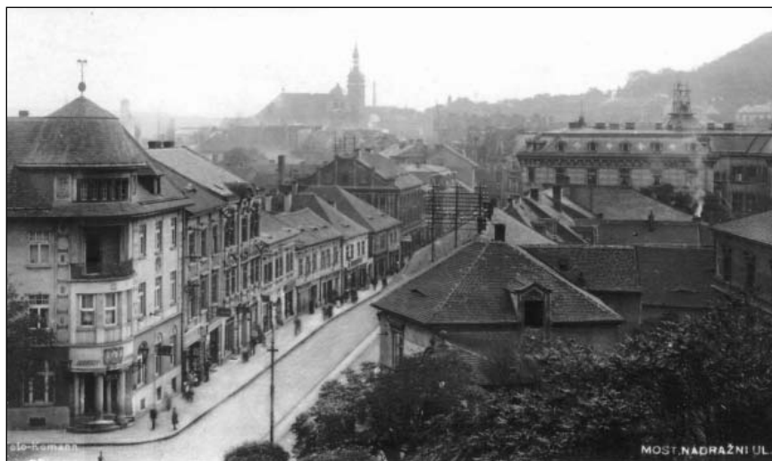
Historické město na mnoha místech volně přecházelo do zástavby z 19. a počátku 20. století, tak jako zde v Nádražní ulici (nedatováno, před rokem 1945)

Bylo přitom nezbytné nabídnout (ve spolupráci s urbanisty a architekty) komplexní řešení problému a postupně přesvědčit zejména centrální stranické orgány o nevyhnutelnosti a přínosu celé akce. Znamenalo to získat pro projekt podporu poměrně široké palety vlivných aktérů, od expertů v různých oborech až po představitele politické moci. Vývoj československé ekonomiky, technologické možnosti i myšlenkový svět doby nicméně inženýrům a funkcionářům těžebního podniku hrály do karet. 17 Po uplynutí další dekády, na přelomu padesátých a šedesátých let, tak již jejich ambicím nestála v cestě žádná vážnější překážka.