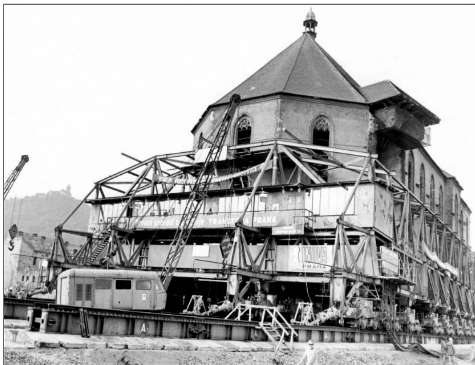
Kostel v pohybu, 11. říjen 1975. Přesun děkanského chrámu o téměř kilometr po kolejích za pomoci speciálních transportních vozíků byl unikátní akcí, která se těšila pozornosti československé, ale i světové veřejnosti

Přesun kostela se nakonec stal ikonou celého mosteckého příběhu a naprostá většina článků o Mostě ze sedmdesátých let se věnovala právě tomuto jedinému aspektu destrukce historického města v zájmu těžby a průmyslového rozvoje. Nešlo přitom o výměnu technokratického – či v užším pojetí produktivistického – pojetí světa za nostalgii a propagaci péče o historické dědictví. Oba narativy se tu naopak proplétaly a navzájem doplňovaly. Přemístění kostela bylo prezentováno a podle všeho i vnímáno jako „technická událost globálního významu“ 78 a novináři pěli ódy na „techniku, která je mostem mezi minulostí a budoucností“. 79 Náročná operace byla explicitně hodnocena jako „příklad technické vyspělosti naší republiky“, tedy dokonce jako vývěsní štít Československa na mezinárodní scéně. 80