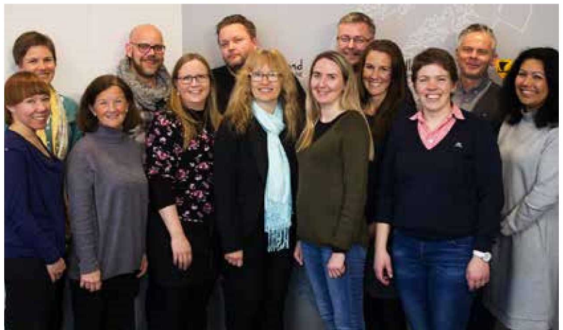
Elev- og lærlingomboda i landet på samling i Bodø