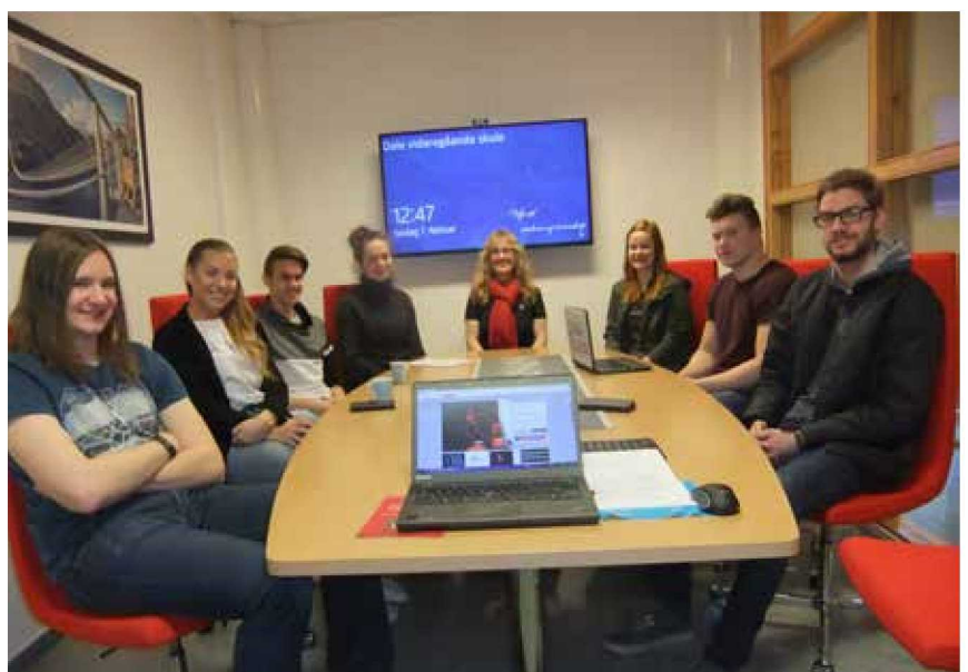
Elevrådet ved Dale vidaregåande skule