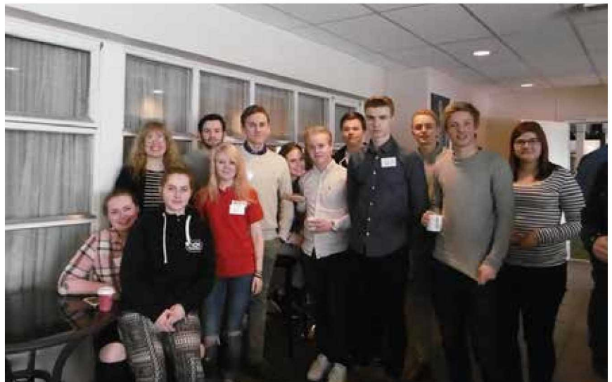
Fylkesting for ungdom

Ombodet ser det som viktig å vere mest mogleg på arenaer der elevar og lærlingar er. I tillegg til skulebesøk, bedriftsbesøk og lærlingsamlingar har ombodet også delteke på yrkesmesser, karrieredagar og ulike arrangement i regi av open skule. Dette er gode arenaer for å møte ungdommen og å gi informasjon til noverande og framtidige elevar og lærlingar.