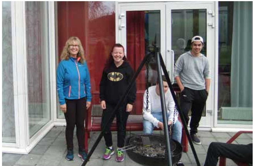
Trivselstiltak på Mo og Øyrane vidaregåande skule

Arbeidet til ombodet dreiar seg i all hovudsak om å bevisstgjere elevar og lærlingar når det gjeld rettar og plikter. Dersom dei opplever problem i opplæringssituasjonen kan dei ta kontakt med elev- og lærlingombodet for å få råd og hjelp. Ombodsordninga er meint å vere eit lågterskeltilbod der ein kjem tidleg på bana før problemet er blitt for stort. Elevar og lærlingar i Sogn og Fjordane er flinke å ta kontakt på eit tidleg stadium. Av den grunn blir dei aller fleste problem løyste på lågast mogleg nivå. Elev- og lærlingombodet har teieplikt og jobbar på eit fritt og sjølvstendig grunnlag. Nettopp det er viktig for ikkje å bli oppfatta som "buk og havresekk". Ombodet fokuserer på korleis elevane og lærlingane sjølve kan vere med å påverke kvaliteten på si eiga opplæring, og korleis ein går fram for å ta opp ei sak med næraste overordna. I Sogn og Fjordane er det inneverande skuleår 4022 elevar og 1161 lærlingar. Korleis førebyggje mobbing har vore hovudfokus inneverande skuleår og er difor også hovudfokus i denne årsmelding.