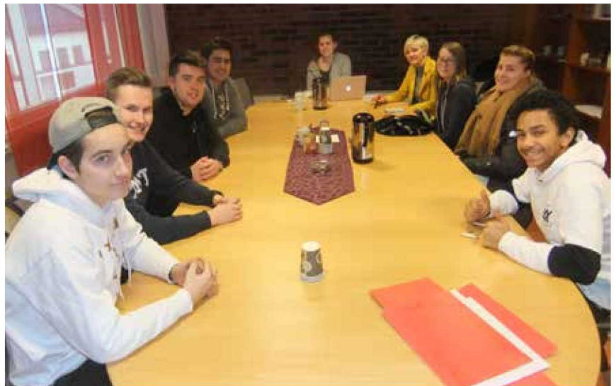
Elevrådet ved Eid vidaregåande skule

Skulemiljøutval: Skal vere eit rådgjevande organ for skulen i arbeidet med skulemiljøet. Kan slåast saman med andre utval, men skal då utvidast medlemsmessig slik at elevane har fleirtal. Utvalet har rett til å uttale seg i alle saker som gjeld skulemiljøet.