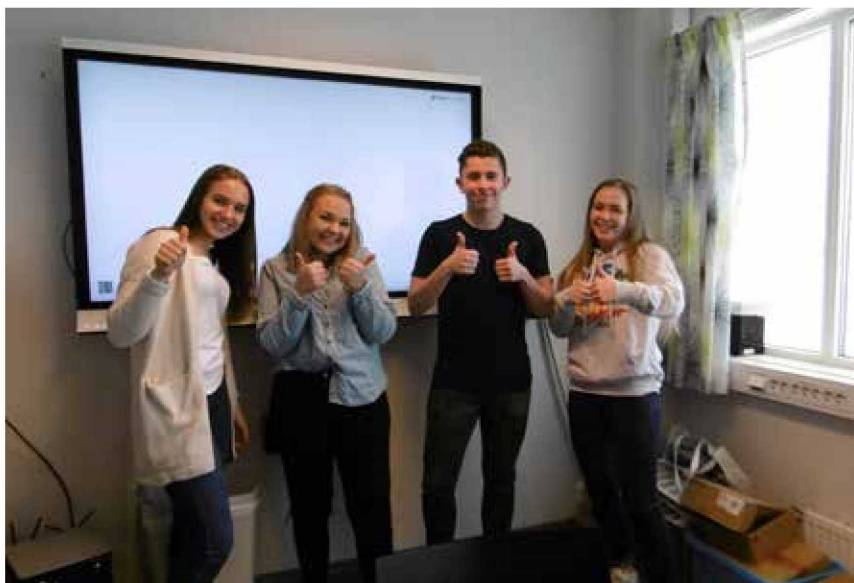
Elevrådsrepr. ved Sogndal vidaregåande skule

"DRØMMESKOLEN" som konsept har ein meir langsiktig strategi og elevane arbeidar på ein demokratisk måte med reglar og planar for klassemiljøet gjennom heile året. Sogn og Fjordane er eit av fire fylke som er med i eit forskingsprosjekt der det blir forska på korleis "Drømmeskolen" spelar inn når det gjeld gjennomføring.