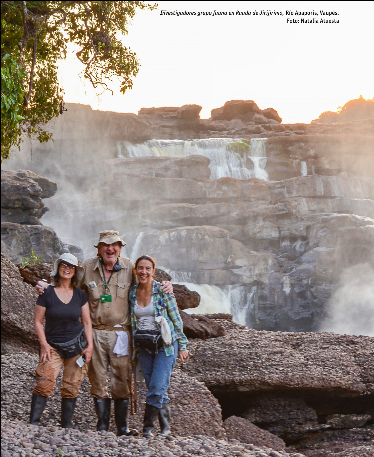
Investigadores grupo fauna en Rauda de Jirijirimo, Río Apaporis, Vaupés.