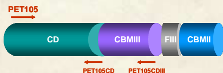
Figura 1. Estructura propuesta para la CBP105 de C. flavigena .

Resultados y discusión. En la figura 1 se muestra la estructura propuesta para la proteína CBP105 y el alineamiento de los oligonucleotidos utilizados para amplificar los fragmentos correspondientes CD y CD-CBMIII.