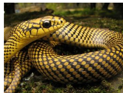
COBRA PHILODRYAS ARNALDOI

(ESCOLA: não é necessário realizar a impressão desta atividade. Enviar via grupos de WhatsApp!)