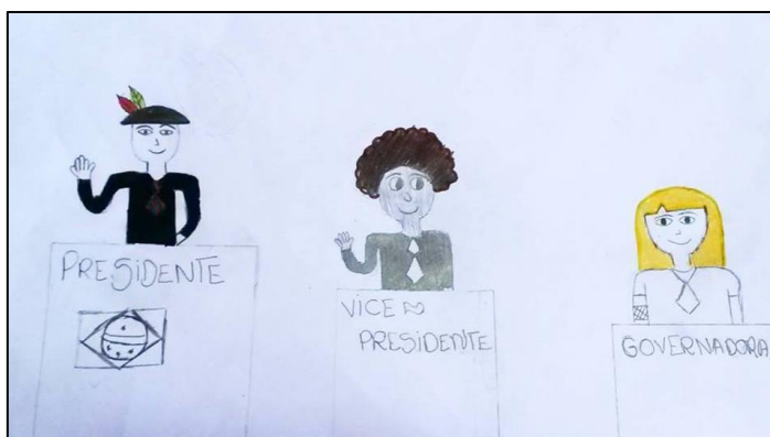
EXEMPLOS – IMAGENS DA INTERNET