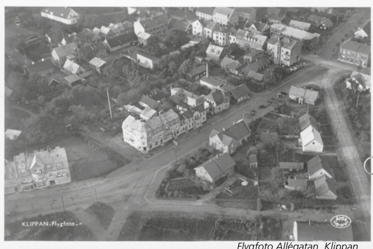
Flygfoto Allégatan, Klippan