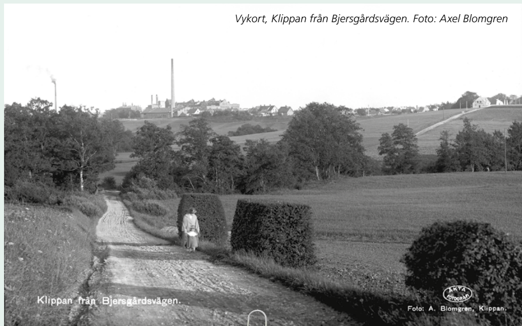
Vykort, Klippan från Bjersgårdsvägen.

Stora vykortsförlag startades av fotografer och tryckare. Axel Eliassons konstförlag, Almqvist & Cöster och Pressbyrå var några av de största företagen som producerade mängder