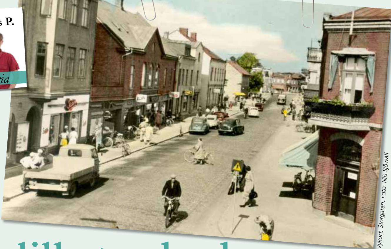
Vykort, Storgatan.