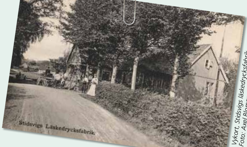
Vykort, Stidsvigs läskedrycksfabrik.

Så här i efterhand, när hälsningar genom vykort har ersatts av mejl och facebook, kan vi vara glada över att Axel Blomgren, Sjövall och deras vapendragare hade kameran med sig då och då. I synnerhet Blomgren lämnade en mängd foton och vykort efter sig; ett sant nöje att kika på dessa kort och drömma sig bort till en tid som passerat för länge sedan!