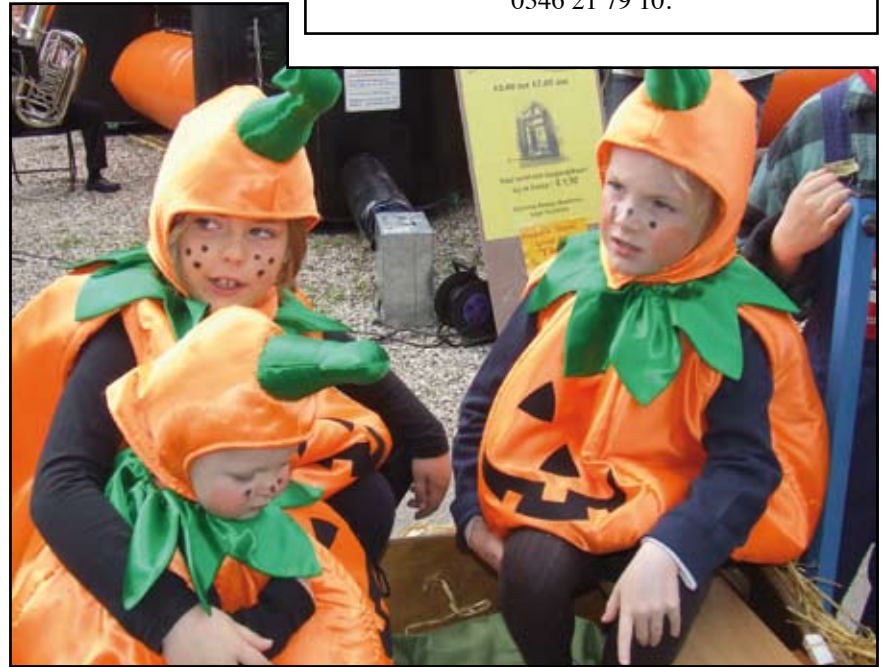
Op Koninginnedag is oranje natuurlijk de hoofdkleur.