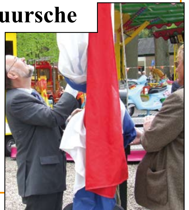
Burgemeester de Groot van Baarn hijst de vlag in Lage Vuursche.