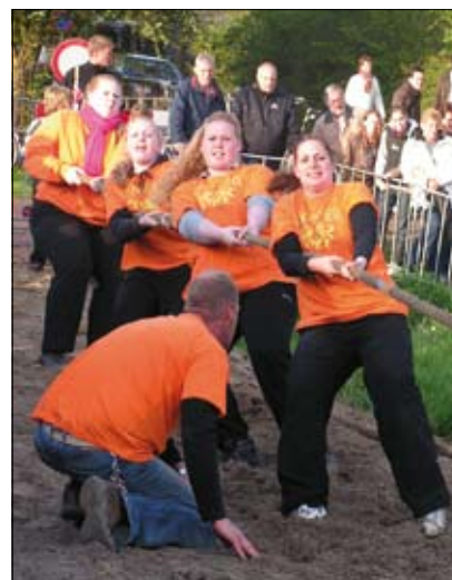
'Miss Holland' was onverslaanbaar.

Het was ronduit hondenweer toen de touwtrekwedstrijd aan de vooravond van Koninginnedag in Westbroek begon. Maar dat was natuurlijk geen