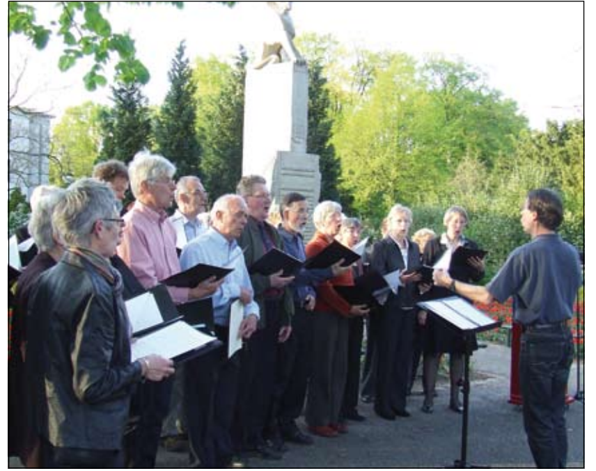
De Koninklijke Biltse Zangvereniging Zang Veredelt

onder ons die de verschrikkingen van de oorlog en de bezetting in hun hart nog elke dag en elke nacht opnieuw doorleven. Mannen en vrouwen met littekens op lijf en ziel, geplaagd door het gemis van hun geliefden.' [GG]