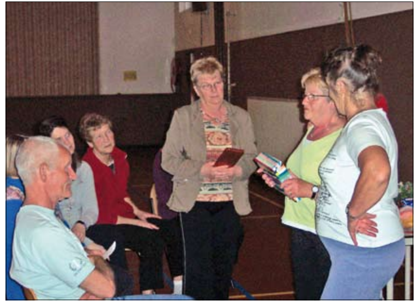
Met toespraken en vele cadeautjes in het zonnetje gezet.

leraar deed en doet nog veel meer. Hij gaf een leven lang al sportlessen. Als militair, bij politie en brandweer. Nu nog aan personeel van een psychiatrische instelling, leidt loopgroepen door het bos en geeft les aan een groep in Tienhoven. Ook daar gaat hij mee stoppen. De dames vertelden hoe hij naast het lesgeven wordt geroemd om zijn humor. Ook nu weer werd er heel wat afgelachen om zijn vrolijke verhalen. Maar er moest toch voor de laatste maal nog gewerkt worden. Het werd met muzikale begeleiding een perfecte oefening vol vaart, die