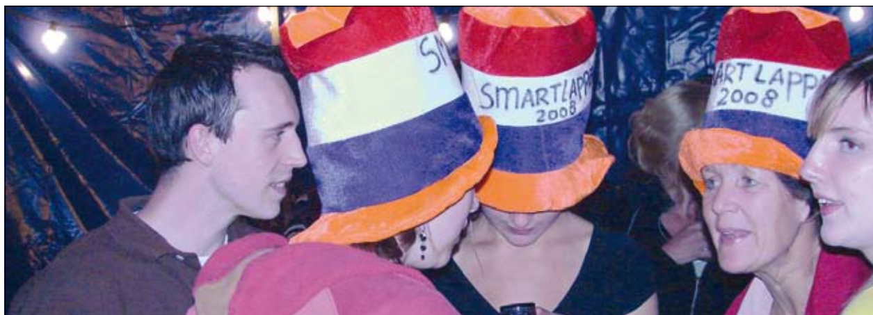
Het smartlappenfestival in de tent leverde mooie liederen over Groenekan op.[SvdL]

boer is. Er is altijd wel een boerderij vlakbij die haar deuren opent. Een lijst met deelnemende melkveebedrijven is te vinden op www.campina.nl . In deze regio doet Boerderij Blauwendraad, Kooijdijk 9 in Westbroek mee.