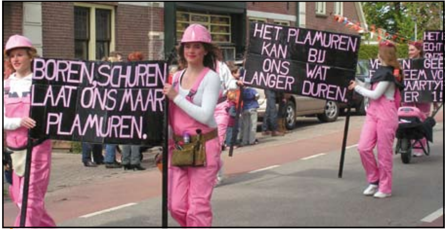
Modern vrouwelijk personeel bood zich aan voor allerlei klussen.

De traditionele Koninginnedagoptocht in Westbroek trok evenals andere jaren weer veel kijkers. De toeschouwers zagen prachtige wagens en opmerkelijke taferelen aan zich voorbij gaan. Er was, zo kon je wel zien, veel tijd en energie in gestoken. Gelukkig was het droog maar wel winderig. Alle deelnemers bleven gelukkig overeind.