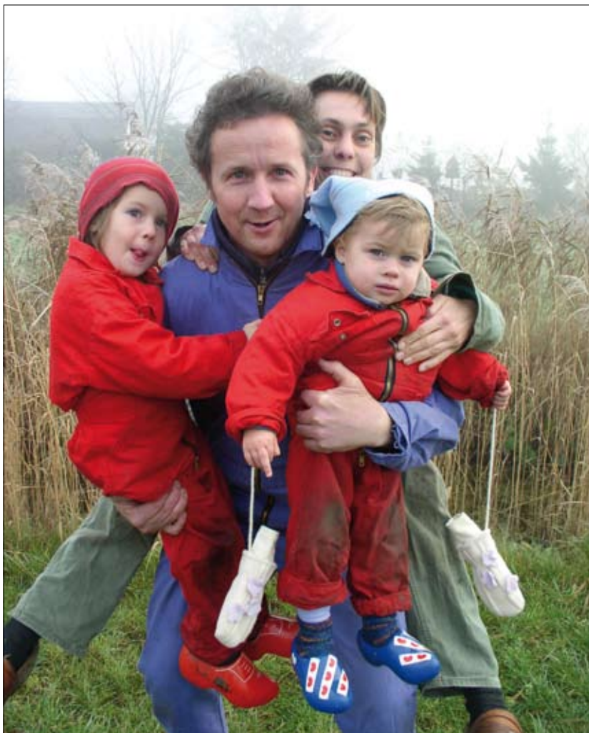
2008 is een soort sabbatical voor 'n Groene Kans.

In 2009 zal de tuinderij weer op de 'oude manier' draaien, met een nieuwe kraam en met een groter assortiment.