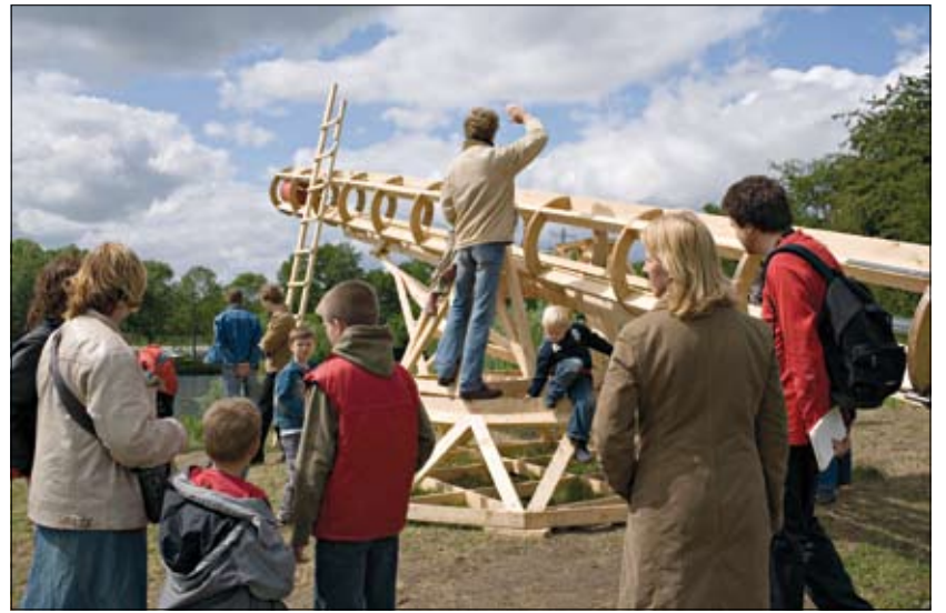
Grote kunst voor kleine mensen

De kinderen kunnen gratis naar KAAP tegen inlevering van onderstaande coupon. KAAP is geopend op alle zondagen en op pinkstermaandag van 11 mei tot en met 22 juni van 10.00 tot 18.00 uur. Meer informatie is te vinden op de website www.kaapweb.nl .