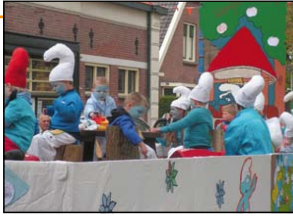
De Stampertjes hadden een prachtige wagen vol smurfen.