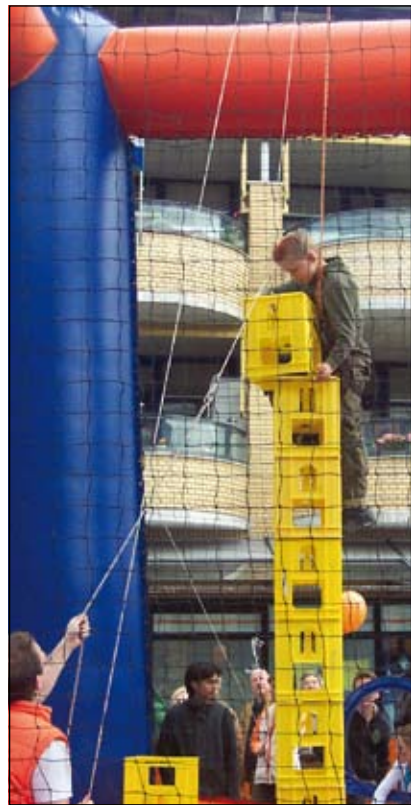
Je kon er kratten klimmen in een kooi.

Het plein stond vol met hoge attracties. Kinderen konden er avonturen beleven. Je kon er kratten klimmen in een kooi, slingerballen op een plateau, jumpen op het springkussen en wie niet bang was kon een hele hoge glijbaan op. Wie had het over bang? Het leek wel circus. Ze doken als getrainde artiesten met de vreemdste sprongen de diepte in. Intussen waren de allerkleinsten daar om de hoek aan het krijten en toverden 35 gekleurde tekeningen op het asfalt.