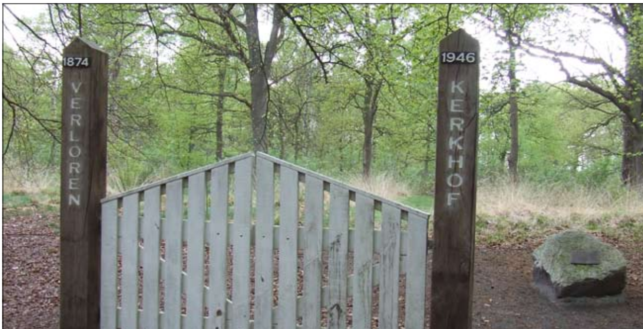
Met het Verloren Kerkhof krijgen ook zwervers het respect dat ieder mens verdient.