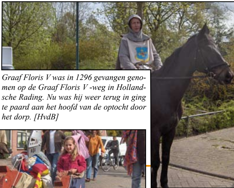
Graaf Floris V was in 1296 gevangen genomen op de Graaf Floris V-weg in Hollandsche Rading. Nu was hij weer terug in ging te paard aan het hoofd van de optocht door het dorp. [HvdB]