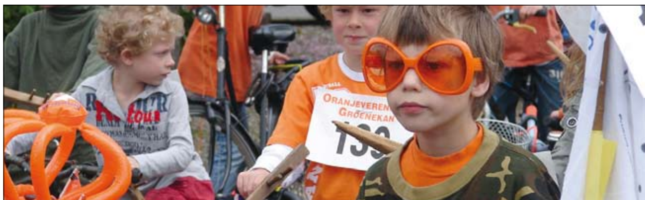
Groenekan - Een extra grote bril om met succes te kunnen ringsteken.