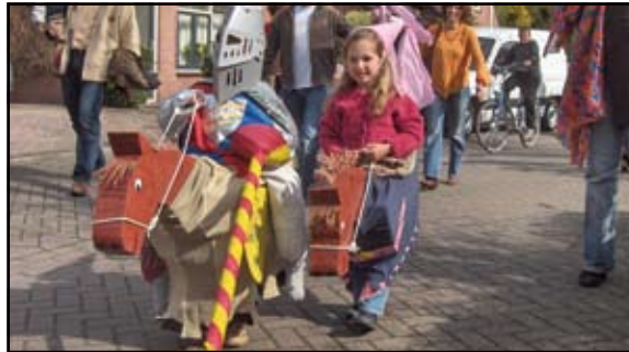
Een kleine nazaat van Graaf Floris V in gezelschap van een alleraardigste gravin liepen (ook) mee in de optocht. [HvdB]