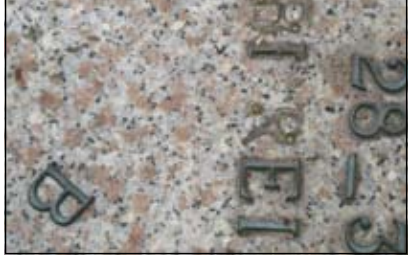
De bronzen letters op de steen waren ervan verwijderd.

totaal verwoest. Vogelnestjes, eieren en dode jongen lagen op de grond en er was duidelijk over de graven heen gelopen. Bij een grafplaat waren de bronzen letters die op de steen gemonteerd zitten verwijderd, deze werden teruggevonden in het zand ernaast.