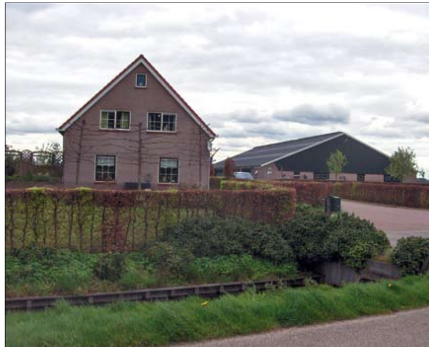
Boerderij Blauwendraad (Kooijdijk 9, Westbroek) zet maandag 12 mei haar deuren open.

Voor de ouders en andere bezoekers is dit eveneens een mooie gelegenheid eens met eigen ogen te zien hoe het er op de boerderij in de buurt aan toegaat. Bezoekers kunnen 12 mei van 10.00 tot 16.00 uur zelf ervaren hoe de natuur en Campinaproducten verbonden zijn en wat de visie van de