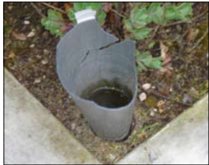
Bloemenvazen werden vernield.

Zij gingen direct naar de begraafplaats om te kijken wat er aan de hand was. Bij het zien van de ravages kregen zij een heel vervelend gevoel: bij een flink aantal graven waren de planten uit de potten gerukt en her en der neergesmeten, de potten waren in de struiken maar ook gewoon achter andere graven gegooid. Ook waren er aluminium plantenhouders die vast op graven zijn gemonteerd als bloemenstandaard gewoon in elkaar getrapt zodat er niets van over was, glazen beertjes waren stuk gesmeten, kaarsenstandaards lagen overal over de begraafplaats, vogelhokjes gewoon van de standaard of bomen gerukt en