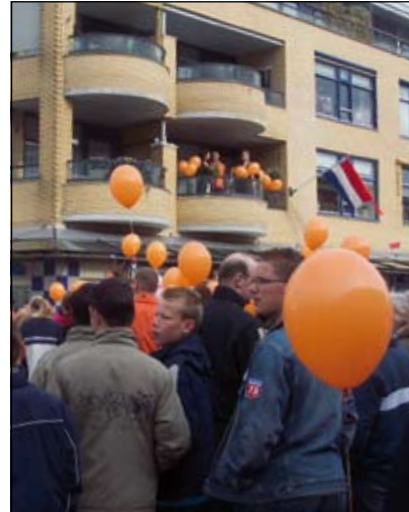
Ook de burgemeester laat ballonnen op?

bers van 'Sterk Spul' te bergen. Ze zaten tot in de hal om te luisteren naar en mee te zingen met heerlijke smartlappen. Wat stralen die mannen een vreugde uit.