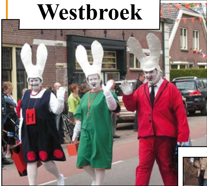
Drie welgevulde Nijntjes maakten de hele tocht te voet