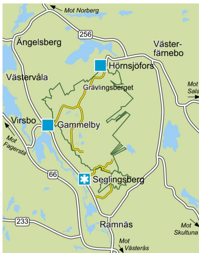
Det finns tre entréer till Hälleskogsbrännan.

Hälleskogsbrännan sträcker sig över 6 420 hektar mark och förvaltas av länsstyrelsen. Naturreseptatet ligger i Sala, Surahammars och Fagersta kommun (Ibid.). Sedan den 4:e oktober 2015 finns en upprustad bilväg som i dagligt tal kallas "Riksettan", vilken går igenom Hälleskogsbrännan, från Hörnsjöfors till Gammelby i Virsbo. Vägen passerar länsstyrelsens huvudbesöksplats Grävlingsberget där bland annat ett 13 meter högt utsiktstorn, samt ett vindskydd som även kan användas som uteklassrum finns till förfogande. Även mindre bilvägar har ställts i ordning mot olika utflyktsmål, men på övriga vägar är det endast tillåtet att färdas gående eller på cykel.