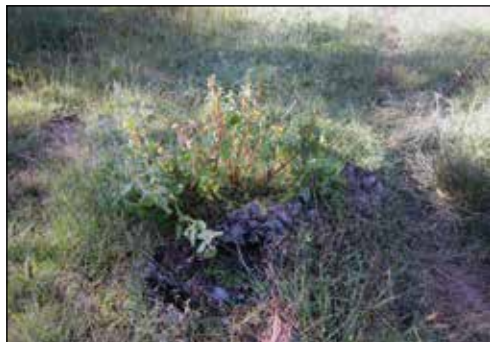
Eukalypsträden ger till slut upp och annan vegetation tar över.

Dessutom gick vi förbi en ”bäck” som det hade blivit mer vatten i sedan eukalypsträden decimerats. Fågellivet har också ökat, vi både hörde fåglarna och såg dem, vi hittade även lite spår på vägen av någon liten antilop. Dessa har också ökat till antal, enligt vår guide.