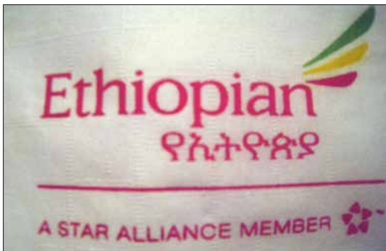
Ethiopian Airlines – nu medlem av The Star Alliance.

- För närvarande koncentrerar vi oss på att förbättra kapaciteten och att få dagliga flyg. Det vi diskuterar är eventuella flygningar från Oslo.