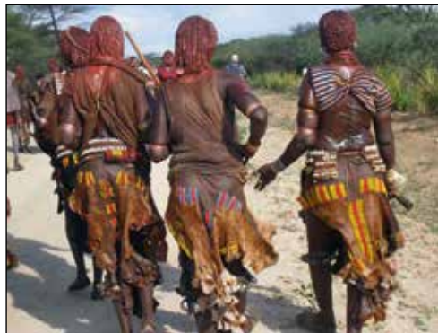
Han klarade det – festen kan börja.

Jo, han klarar det och vi kan vandra hem till campen, där vi serveras kött med goda grönsaker till middag. Jag undviker att titta upp mott slutningen. Förstår att geten inte längre står där.