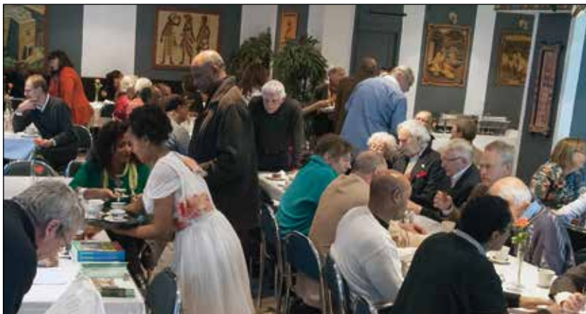
Flera föredrag bjöds deltagarna på Höstmötet på liksom information om Framtidsgruppen.