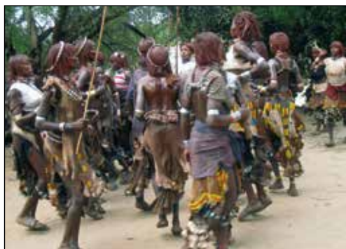
Skrammel, stampanden, sång...

Vi äter lunch när vi hör skramlet av bjällror som växer sig allt starkare. Ser ledet av kvinnor som rör sig över flodbädden. Från andra hållet närmar sig män i höftskynken, på huvudet har de diadem av små, färgade pärlor. En av dem har fäst en hög fjäder i håret. I famnarna avbrutna trädgrenar, som ska användas att piska med. ”Åt ni i lugn och ro. De kommer att dansa i timmar innan det blir dags för mannen att hoppa mellan oxarna”, säger Håkan.