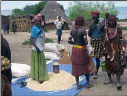
Stor eller liten marknad – överallt drar vi turister till oss intresse.