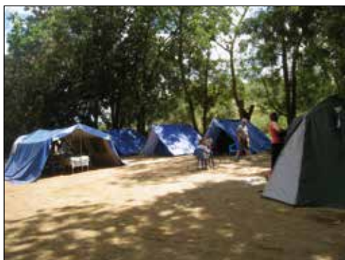
Campen under mangoträden.