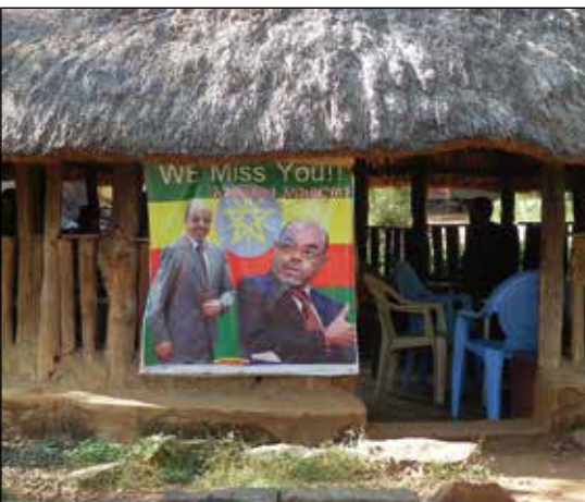
I varje liten by affischer av den hädangångne Meles Zenawi.

Ända sedan barnsben har jag vetat att det finns många olika etniska grupper i Etiopien, att det talas uppåt 80 olika språk i landet och att det titt som tätt blossar upp stridigheter mellan de olika folkstammarna. Men nu fick jag ”uppleva” det genom den ändring av resrutten som vi fick göra med anledning av en pågående beväpnad konflikt, strax söder om Mizan Teferi, mellan Surma-folket och deras grannar. Orsaken till konflikten lär vara guld, som även bergsfolket Amhara vill vaska i området.