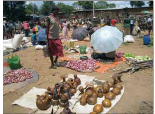
Frågan är hur länge marknaderna kommer att se ut som de gör nu?

hela raden av oxryggar. Balansakten upprepas flera gånger.