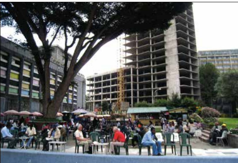
Tillbaka i Addis.