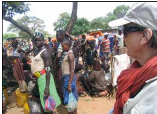
Många olika etniska grupper finns det i landet.

Redan vid ankomsten till Bole International Airport såg jag dem: bilderna av den i augusti avlidne premiärministern Meles Zenawi. När vi en halvtimme senare svängde in på Meskel Square möttes vi av gigantiska fotomontage av den visionäre ledaren Meles. I Bishoftu har man förutom jättelika Meles-fotomontage på strategiska ställen även retuscherat den gamla "äroporten" över vägen som ligger nedanför gamla hotellet och leder till bl.a. "vår" skola. Hammaren och skäran har ersatts av typiska etiopiska motiv jämte den visionäre Meles. Det etiopiska folket – åtminstone den kristna delen - tycks uppriktigt sörja och sakna honom. Hans efterträdare, Hailemariam Desalegn, har inte någon lätt uppgift framför sig. Det har jag till fullo förstått efter det 24 dagar långa besöket i Etiopien.