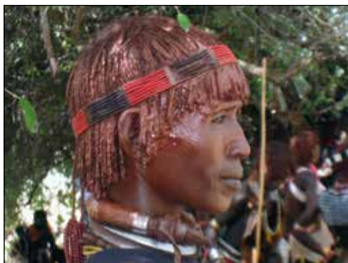
Hamerfolket – runt 50 000 personer.

Turmi - här bodde vi för tio år sedan. Mangoträden som skuggar våra tält har vuxit rejält sedan dess. Trodde inte att vi skulle komma hit igen. Men här bor vi nu, i fem dygn, alldeles bredvid floden Keski,