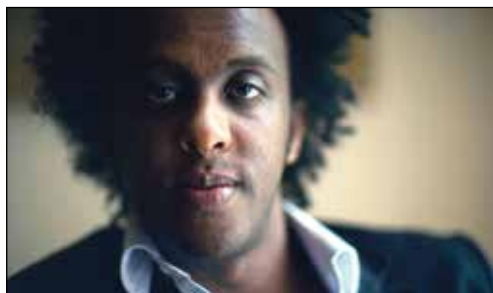
Dinaw Mengestu.