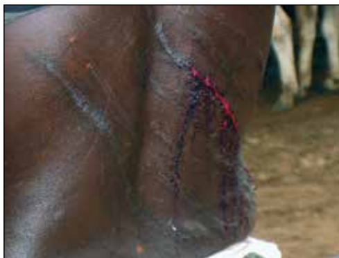
Ett snabbt rapp och blodet sipprar fram.

pulverliknande i näsan. Hur de sedan dansar fram till mannen med piskan i handen, hur de provocerar honom, för att sedan, blixtsnabbt, vända sig om lagom tills rippet kommer. En tunn, lång reva på huden och blod sipprar fram. Tittar på de andra kvinnornas ryggar, fulla av ärr och undrar hur länge den här traditionen kommer att leva kvar. Förhoppningsvis inte alltför många år till.