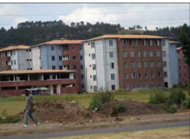
Nya bostadshus – överallt.

Utvecklingen längs de största vägarna är imponerande. Överallt reser sig nybyggda och halvfärdiga huskroppar – Etiopiens ”miljonprogram” är i full gång. Men många