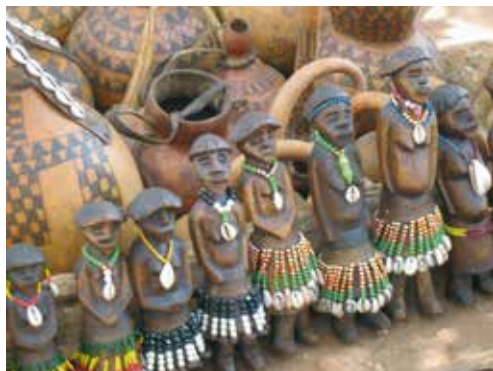
Varor för lokala behov, men även turistanpassade ting.

Männen tycks snabbare västerniseras, åtminstone i klädedräkten, men höftskynke och färggrant band i håret är populärt. Vi campade ganska nära Turmi och där bor just Hamerfolket.