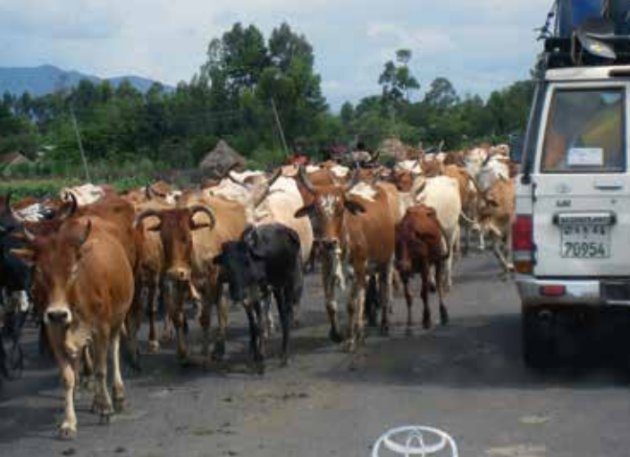
Många djur på vägen...

Vägarna i Etiopien har bilisterna alltid fått dela med boskap, får och getter. Men aldrig har väl dessa djur varit så många som nu. Man räknar med att de är lika många som landets invånare. De allra flesta chaufförer är emellertid förvånansvärt skickliga på att ta sig förbi utan att skada något av de dyrbara djuren.