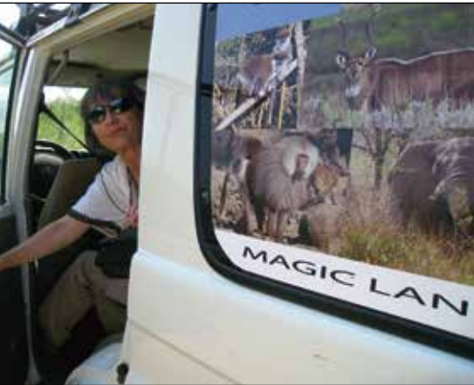
Drygt 350 mil åkte vi.

Mellan den 10 oktober och 3 november besökte jag Etiopien för andra gången i år. Förutom de sedvanliga besöken i Bishoftu och Addis gjorde jag och mina reskamrater - de flesta av oss pensionerade "Bishoftubarn" - en fantastisk rundresa i sydvästra Etiopien.