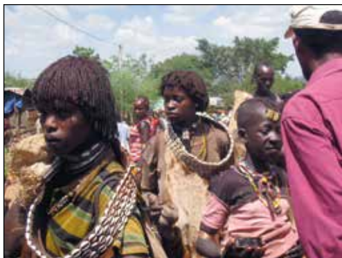
Kvinnor på marknaden i vackra flätade frisyrer.

Många har klätt sig i "stammens" traditionella dräkt. På den första marknaden vi besökte i Demeka var det mest Hamer-folket som höll till. Det är spännande människor. Damerna vackra i sina flätade frisyrer med mycket fett och färg i håret. Klädda i skinn och med ett speciellt metallsmykke runt halsen. Kaurisäckor likaså och många rader med färgglada pärlor.