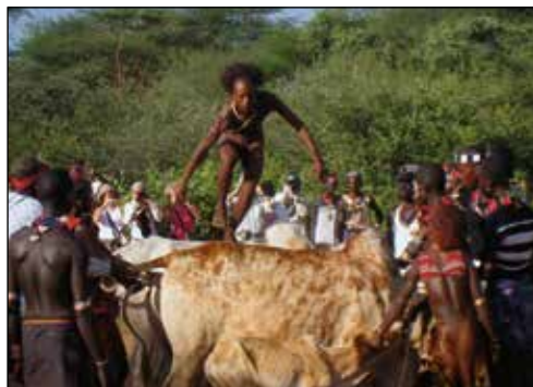
Flera gånger springer han, fram och tillbaka.

På en öppen plats väntar hjorden med boskap och nu följer några kaotiska minuter innan de kastrerade tjurarna placerats på led. Kvinnornas dans drar igång igen. Stampandet, sången, bjällerklangen, oxarna som trilskas – och nu blandar sig också några män in i dansen. Tryckt intill några oxar väntar den nakne mannen som snart, åtta gånger, kommer att hoppa från ox till ox.