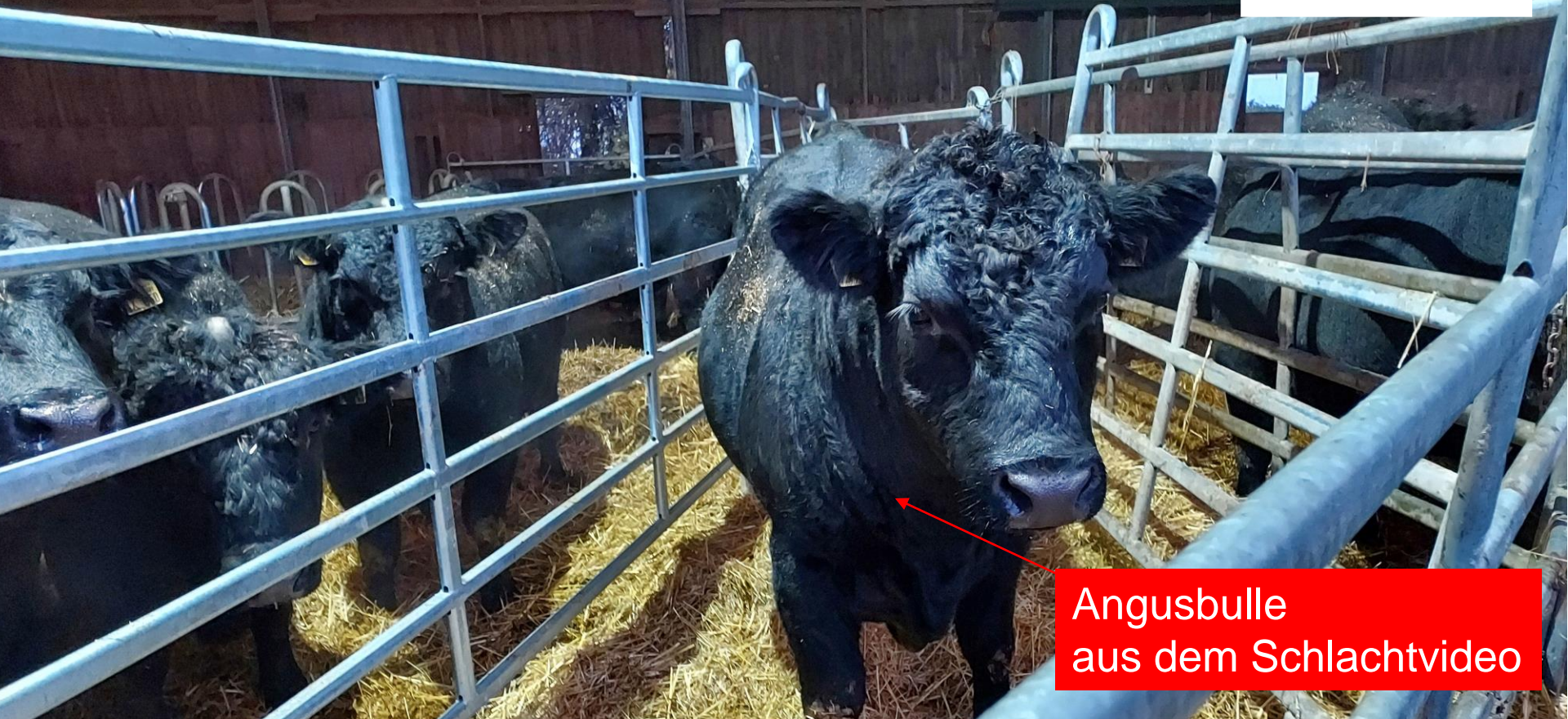
Angusbulle aus dem Schlachtvideo