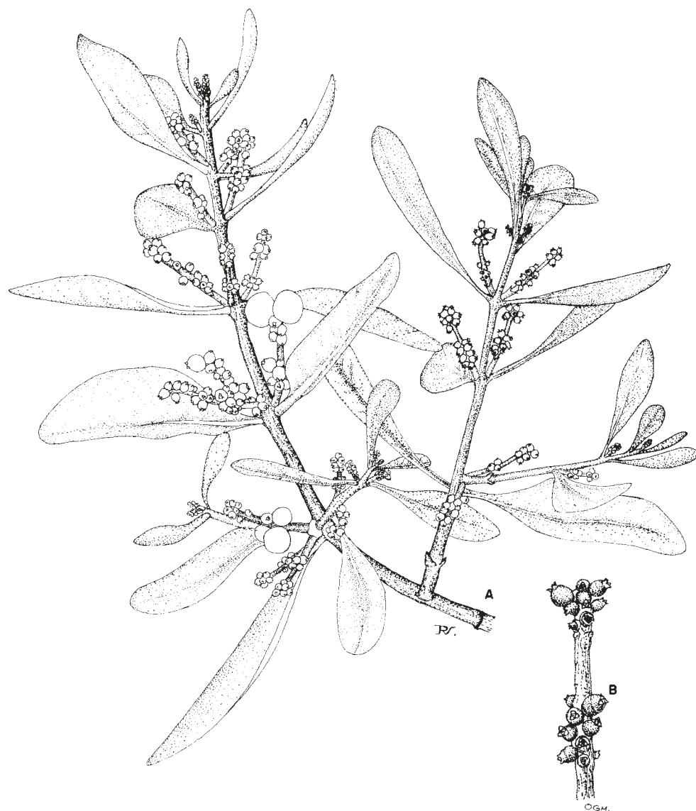
Fig. 2. Dendrophthora costaricensis Urban (M. Cházaro y H. Oliva 5253, IBUG). A. Ramilla con frutos jóvenes y maduros; B. Espiga femenina, con frutos muy jóvenes.