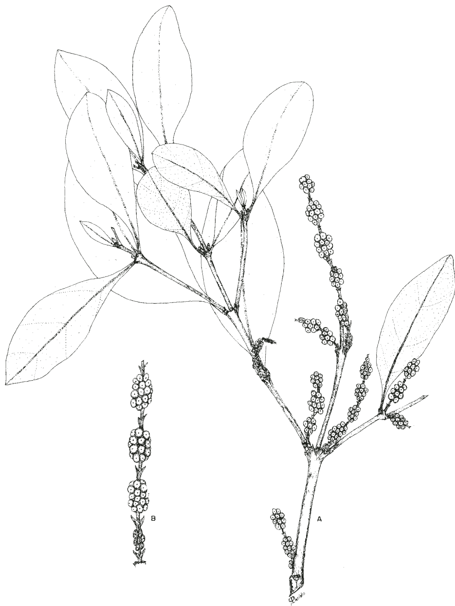
Fig. 1. Phoradendron oliverianum Trel. A. Rama con infrutescencias; B. Infrutescencias (P. Tenorio L. et al. 13925, MICH Y MEXU).