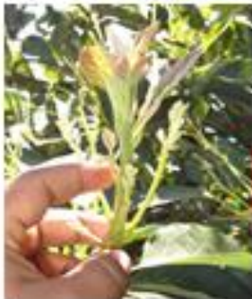
Aplicación de Fosetyl Al Al suelo

Calendario de aplicaciones preventivas para proteger a la planta de un posible ataque de Phytophthora