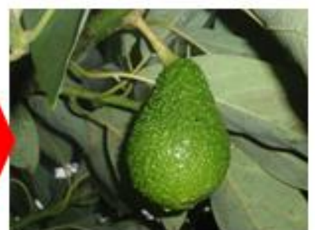
Aplicación de fosfito de potasio foliar