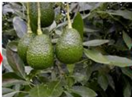
Aplicación de Fosfito de potasio al suelo