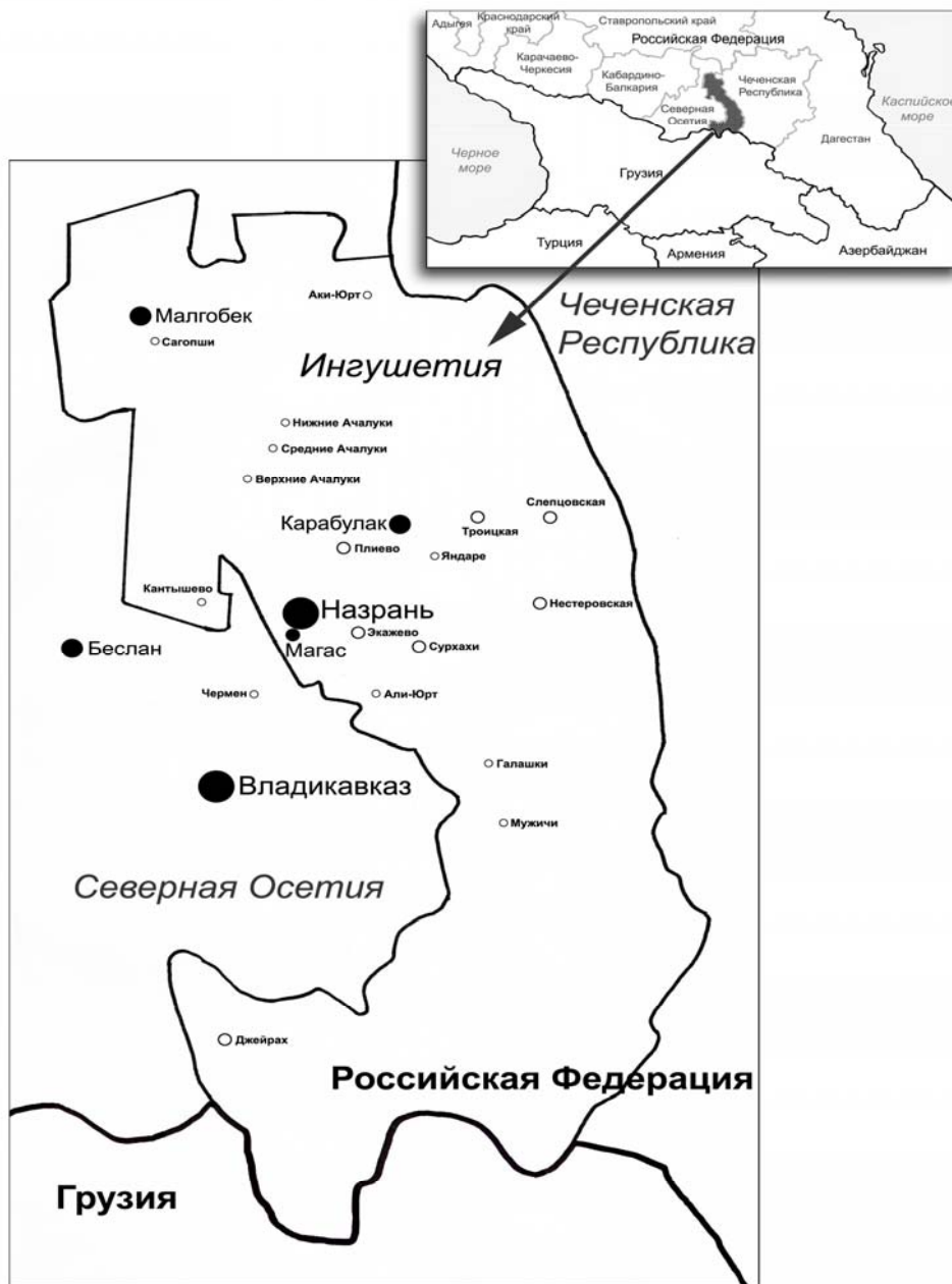
Карта Ингушетии и ее местоположения в регионе