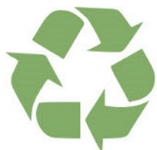
Symbole du recyclage

Afin de préserver au mieux les ressources de notre planète, il faut bien trier ses déchets car ils peuvent avoir une seconde vie. Par exemple le verre, le plastique, le papier, le carton ou encore l'aluminium sont recyclables : c'est-à-dire qu'une fois utilisés, s'ils sont jetés dans une poubelle de tri, on peut les réutiliser sous une autre forme :