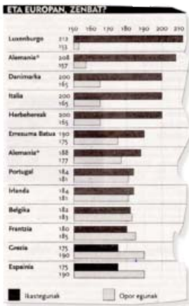
Iturria: ZABAIK. 2001-7.