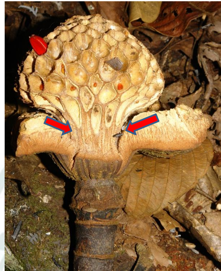
Esquistosincarpio en Magnolia hernandezii

Un fruto compuesto por un agregado de folículos, c/u con dehiscencia longitudinal