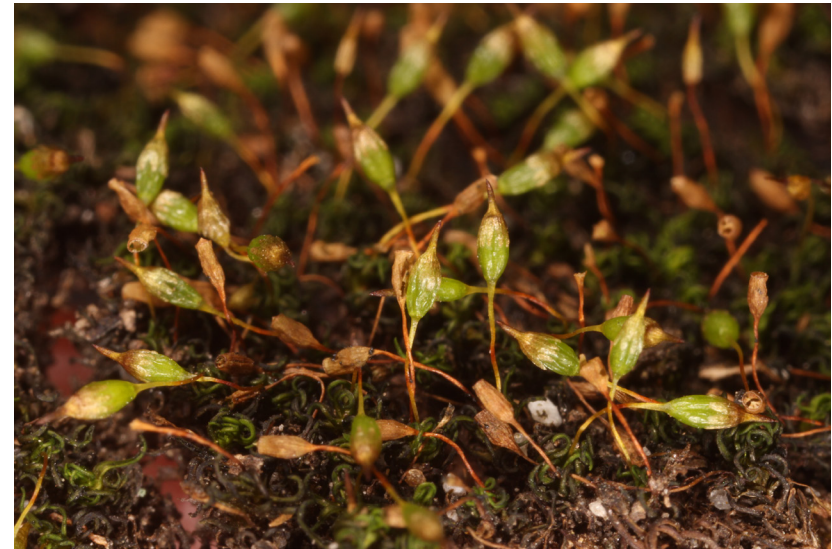
Abbildung 1. Ptychomitrium incurvum , trockenes Herbarexemplar von Sementina.

Die Art ist schon im Gelände als solche makroskopisch zu erkennen. Im Vergleich zu P. polyphyllum ist die Art winzig, nur einige Millimeter hoch, hat aber die klas-