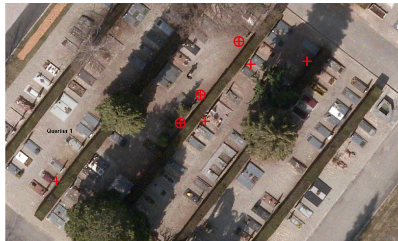
Figure 1. Exemple de cartographie dans le cimetière St-Georges. Les lichens terricoles se trouvent au pied des haies, particulièrement du côté nord-est, ombragé le matin. Collema tenax est représenté par une croix (+), Collema crispum par un cercle (o).

Les cimetières offrent des habitats favorables aux lichens terricoles, sur les zones de terre nue intersticielle, que ce soit au bord des chemins, au pied des murs ou parmi un gazon lâche. La nécessité d'engazonner les zones de gravier se comprend lorsque l'on mesure les efforts nécessaires au désherbage manuel de grandes surfaces. Le désherbage chimique étant désormais limité à des cas particuliers, l'engazonnement paraît une solution moins onéreuse que le traitement thermique. Il serait toutefois dommage que les cimetières évoluent vers l'apparence de parcs aux gazons impeccables. Certaines zones en effet, comme le dessous des arbres, ne conviennent tout simplement pas à l'engazonnement. Il est donc conseillé d'appliquer