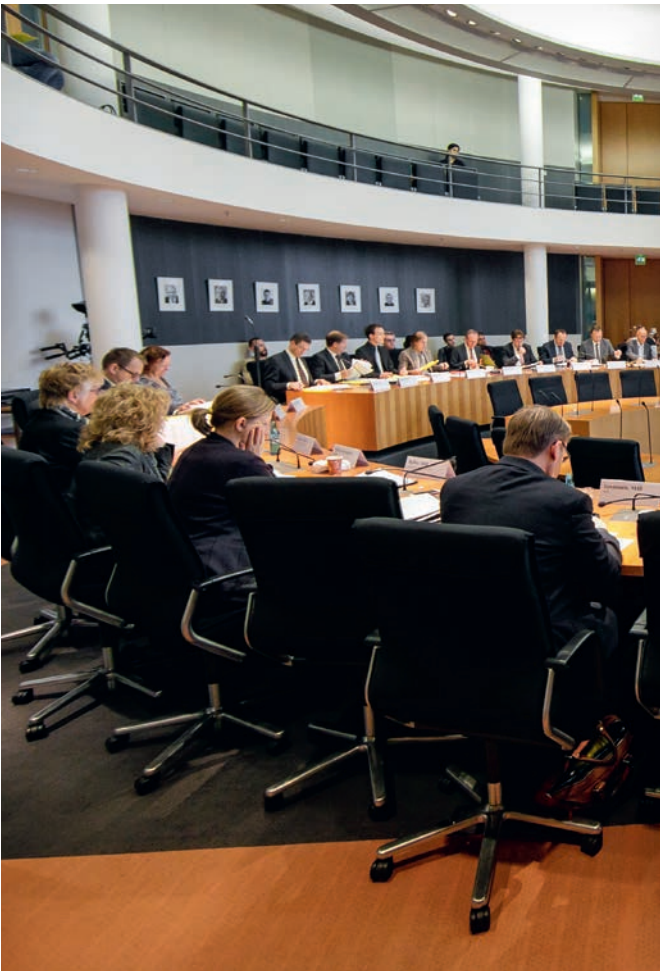
Die Ausschüsse des Bundestages tagen in den Sitzungssälen im Paul-Löbe-Haus.