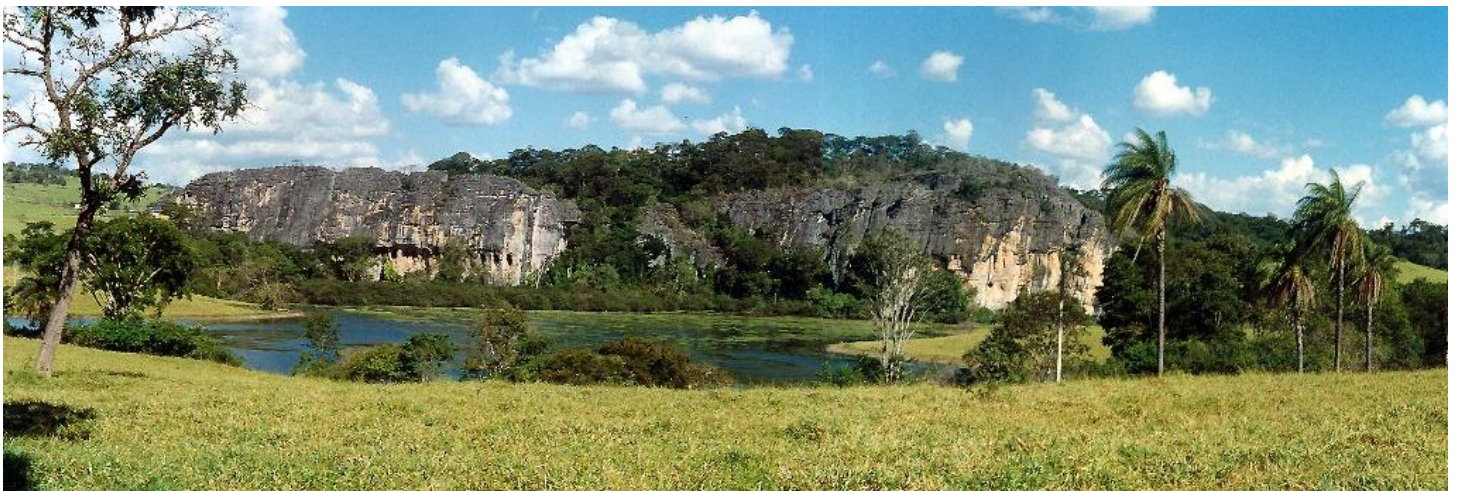
Cerca Grande (Lagoa Santa MG) - desenho: Andreas Brandt - vide páginas: 30 e 31.