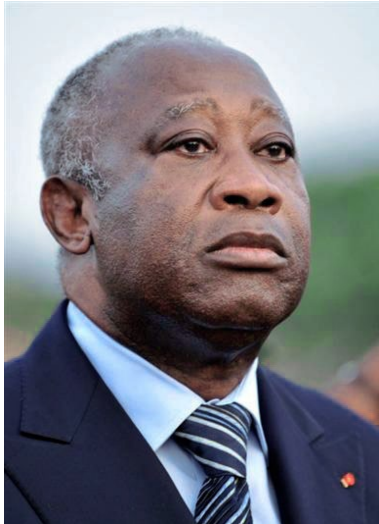
Laurent Gbagbo [1]

Od Gbagbovho transferu do Holandska po začiatok hlavného pojednávania v januári 2016 uplynul značne dlhý čas. Vo februári 2013, kedy senát pre