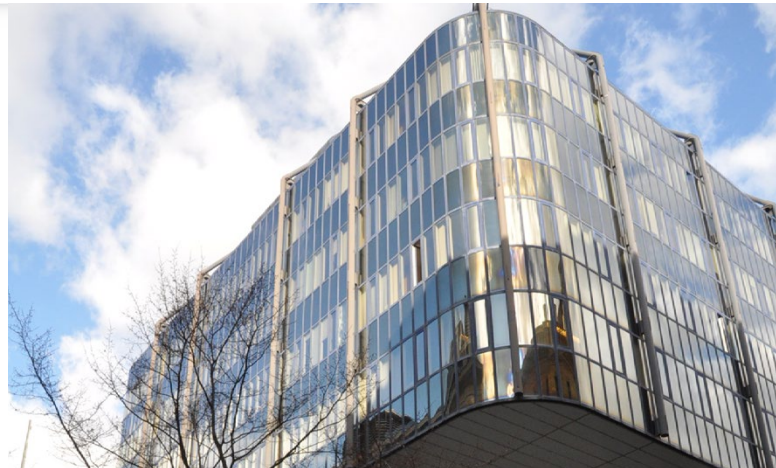
Budova vídeňské univerzity [2]

Byl jsem předsedou tzv. COST Action, výzkumného programu financovaného EU ohledně role Evropské unie v reformě systému OSN pro ochranu lidských práv, a v našich společných doporučeních