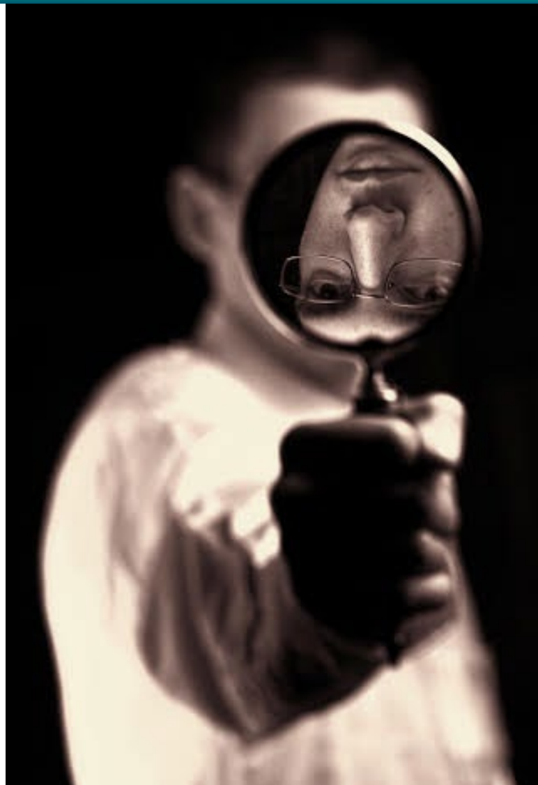
Kenz magnified [1]

Pred rumunským súdom navrhovateľ tvrdil, že zamestnávateľ svojím postupom porušil jeho právo na ochranu listového tajomstva zakotvené v Rumunskej ústave a trestnom zákone. Rumunské súdy však rozhodli, že postup zamestnávateľa, ktorý čítal elektronické správy svojho zamestnan-