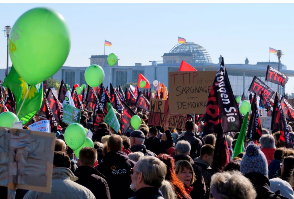
Protest proti TTIP v Berlíně [1]