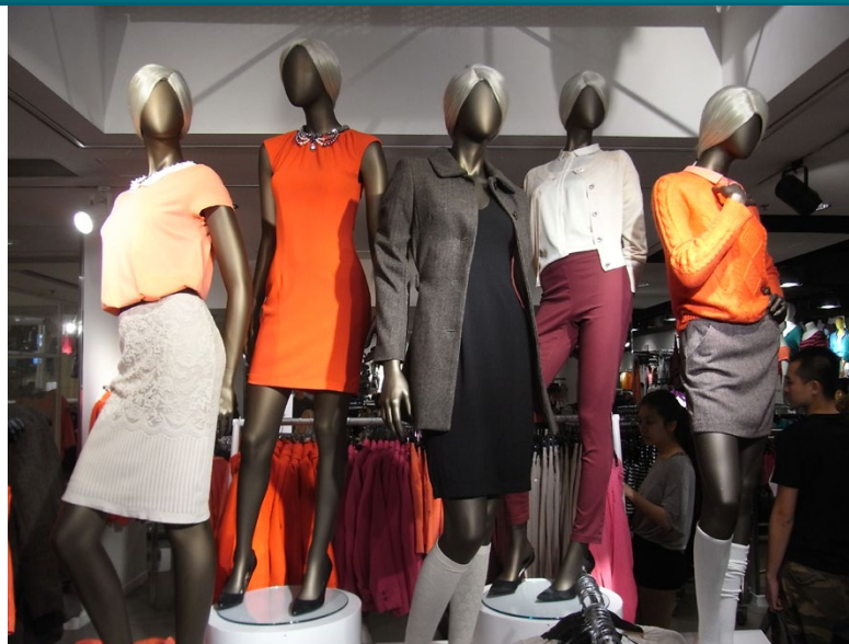
Obchodní dům H&M [1]

Skutečnost, že pouze minimum respondentů přiznalo odhalení vykořisťování běženců v továr-