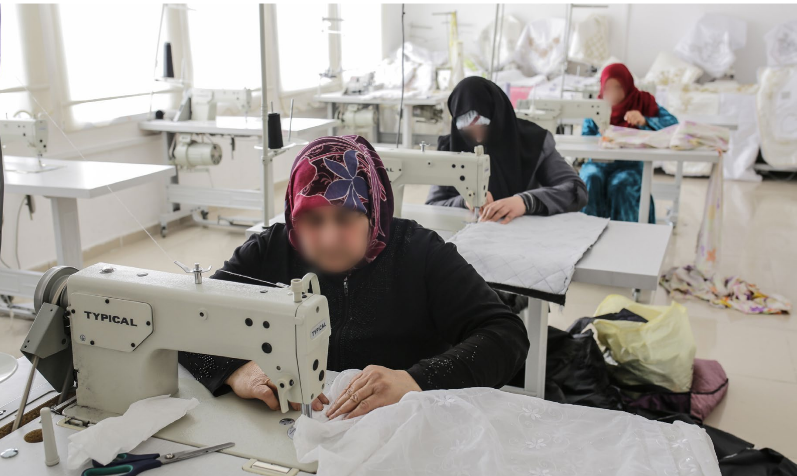
Syrská uprchlická krize [2]

ani ne desetiletí nezletilí jsou pak zaměstnáváni v oděvních a obuvnických továrnách, továrnách na sušené ovoce, automechanických dílnách či v zemědělské produkci jako sběrači. Pracují na plný úvazek osm ale i dvanáct hodin denně za stejně nízké mzdy jako jejich rodiče.