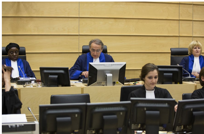
Soudní senát při vyhlášení rozhodnutí o vině [2]

Nesmí zůstat bez povšimnutí ani to, že konec svého trestu si Katanga odpykával ve věznici v Demokratické republice Kongo (dále jen “Kongo”). Soud v prosinci 2015 určil Kongo jako stát, ve kterém se vykoná trest odnětí svobody (čl. 103 Římského statutu). A to nikoli pouze pro Germaina Katangu, ale i pro dalšího odsouzeného Thomase Lubangu Dyllo. Stalo se opět poprvé v historii soudu, že odsouzené převzala země jejich původu pro výkon trestu.