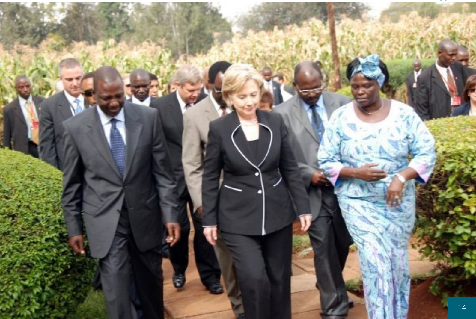
William Ruto při státní návštěvě s Hillary Clintonovou [2]