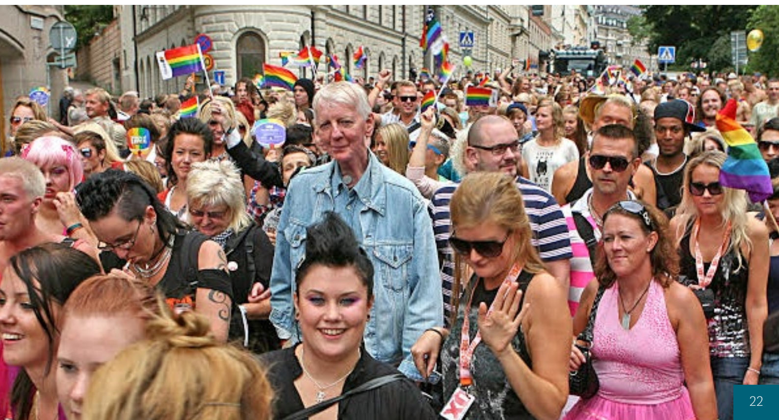
Stockholm Pride Parade 2009 [2]