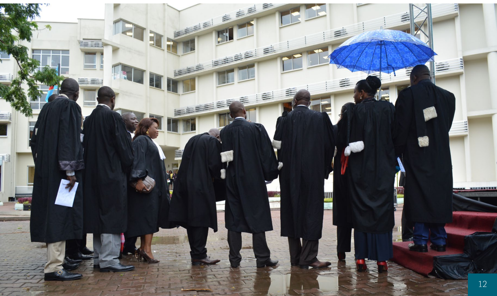
Inaugurace nové budovy konžského Ústavního soudu [3]