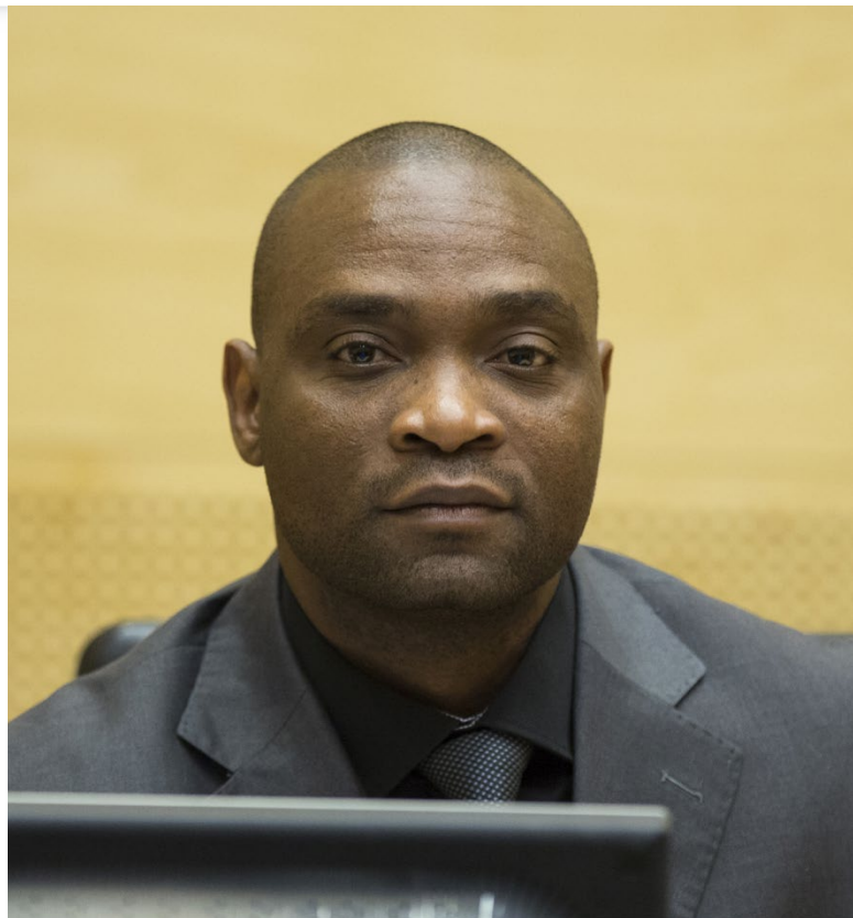
Germain Katanga při vyhlášení rozhodnutí o délce trestu [1]

Soud rozhodoval v tomto režimu poprvé ve své historii právě v Katangově případě v listopadu 2015. Senát tří soudců rozhodl o snížení jeho trestu o tři roky a osm měsíců.[2] Svůj trest tak Katanga dovršil dne 16. ledna 2016. Soudci přihlédli především k tomu, že Katanga se soudem nadále spolupracoval a že opakovaně a veřejně převzal odpovědnost za své zločiny a vyjádřil lítost obětem svých zločinů.