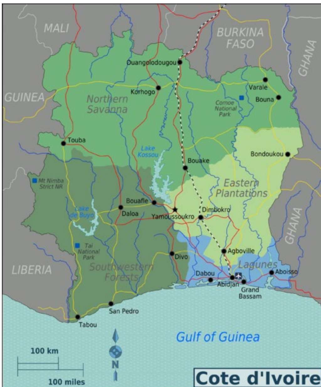
Mapa Pobřeží slonoviny [2]

[2] Mapa Pobřeží slonoviny, autor: Burmesedays 20. január 2010, www.wikimedia.org , Creative Commons CC BY- SA 3.0