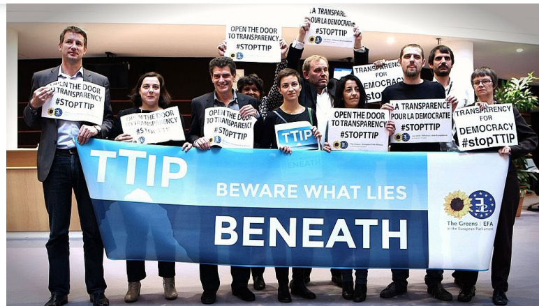
Odpůrci jednání o TTIP v Bruselu [3]

Nedávno se například objevil nový návrh na zásadní změnu způsobu výběru rozhodců pro arbitráže v rámci TTIP. EU navrhuje, aby místo nominace rozhodců dle výše popsaného systému vznikl jakýsi nový stálý rozhodčí soud, který by řešil otázku nezávislosti a nestrannosti rozhodců a posílil jejich demokratickou kontrolu. Je nicméně otázka, zda