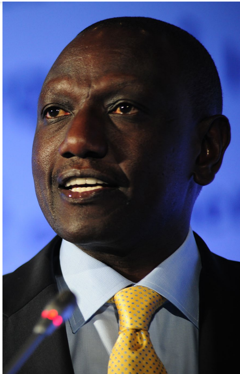
William Ruto [1]

Nyní musí prokuratura přijít s novými důkazy, v opačném případě hrozí, že kauza Ruto bude sledovat stejný osud jako případ Kenyatta. V obou případech obžaloba tvrdila, že ke změně svědeckých výpovědí došlo v důsledku nátlaku, zastrašování a úplatkářství.