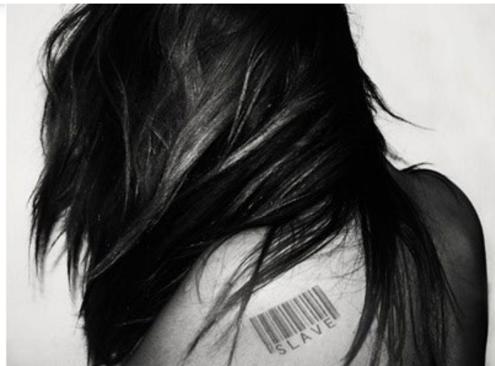
Žena jako oběť nucené prostituce [1]

Podle ESLP v sobě článek 4 EÚLP zahrnuje pozitivní závazky státu týkající se ochrany obětí obchodování s lidmi. Ačkoli řecké právo je v obecné rovině způsobilé těmto závazkům dostát, tak v uvedeném případě tyto závazky nebyly splněny. Stěžovatelka se setkala ze strany policie a dalších orgánů s neochotou při vyšetřování případu a zároveň nebyly naplněny procesní záruky dostupné prostřednictvím národního práva.