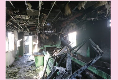
出处：(公益财团法人)日本容器包装再利用协会