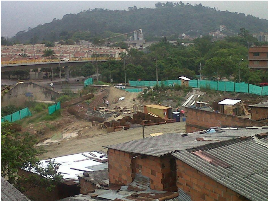
Proceso de construcción del puente de conexión Aburrá-Cauca