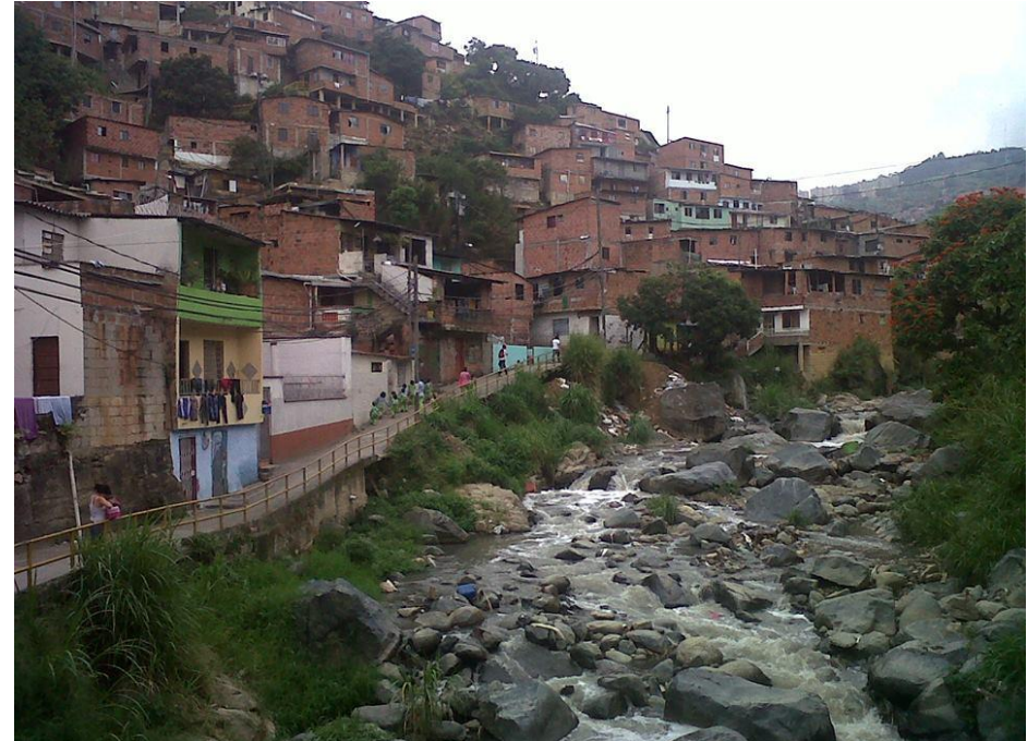
Vista desde el interior del barrio