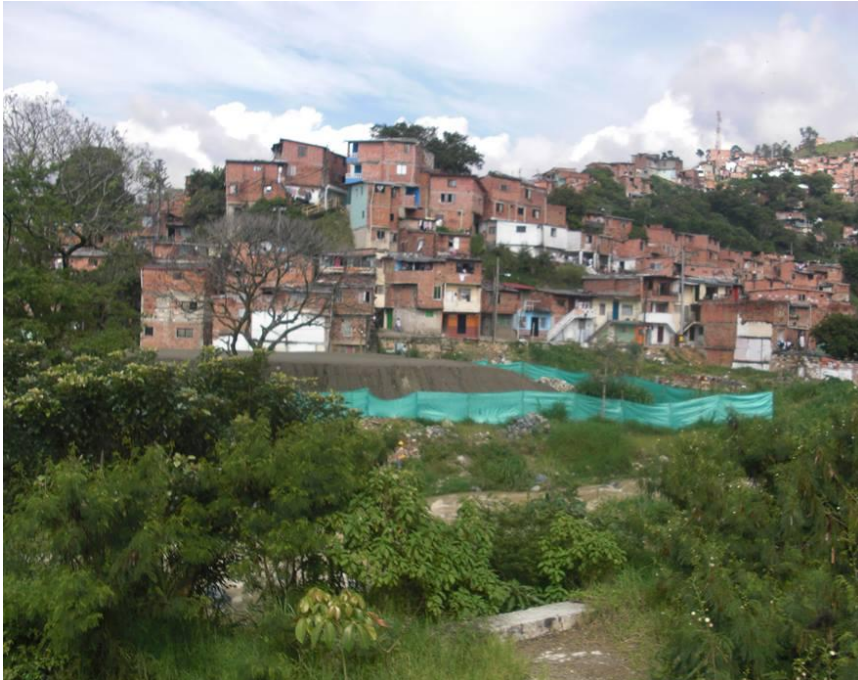
Vista desde el exterior del barrio