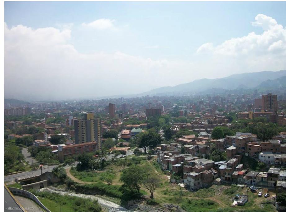
Medellín vista desde el barrio