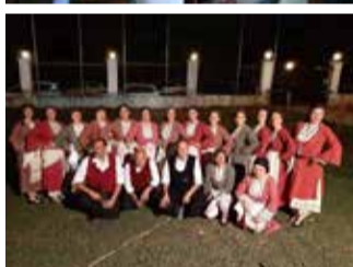
Σεπτεμβρίου και όσοι ενδιαφέρονται