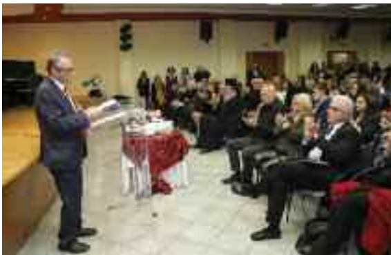
Ο Πρόεδρος του ΔΣΠ απευθύνει χαιρετισμό

κείου Πειραιά και ο κ. Νικόλαος Μακρής, ε.τ. Πρόεδρος του Αναθεωρητικού Δικαστηρίου, ο κ. Αντώνιος Πλακίδας, Πρόεδρος του Τριμελούς Συμβουλίου Δ/σεως Εφετείου Πειραιά, ο κ. Νικόλαος Κουτρούμπας, Πρόεδρος του Τριμελούς Συμβουλίου Δ/σης του Πρωτοδικείου Πειραιά, η κ. Ειρήνη Τζίβα, Προϊσταμένη της Εισαγγελίας Πρωτοδικών Πει-