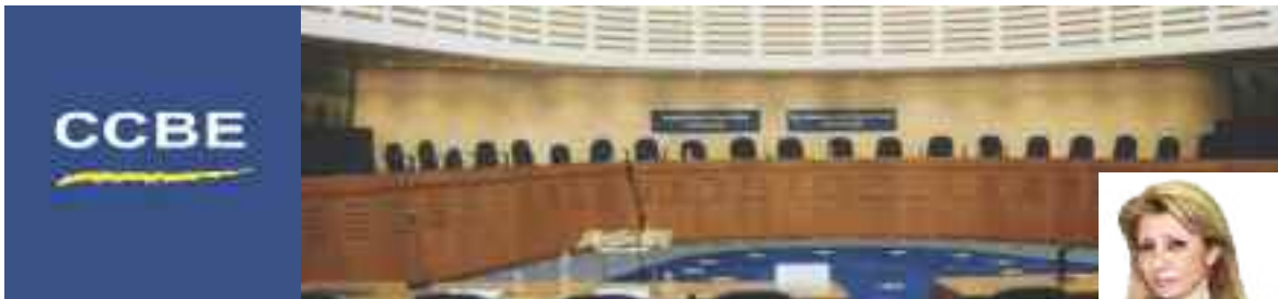
της Μαίρης Φλωροπούλου- Μακρή τ. Αντιπροέδρου ΔΣΠ