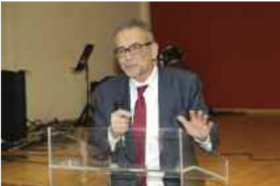
Ο Πρόεδρος του ΔΠΣ κάνει τον απολογισμό της χρονιάς

Ο Δικηγορικός Σύλλογος Πειραιά, έκοψε την Πρωτοχρονιάτικη πίτα του, την Κυριακή, 14 Ιανουαρίου 2018, στην αίθουσα εκ-