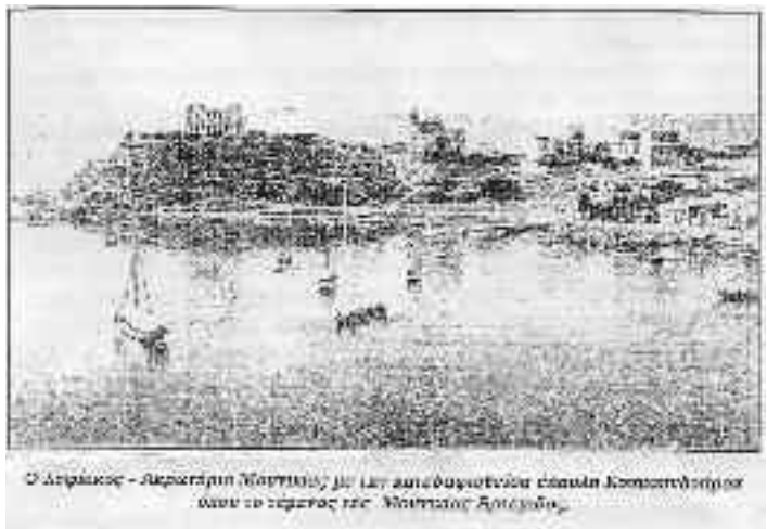
Ο Διφρακός - Ακρόαση της Αθήνας με την απόδοξη του ελληνα Κροατιστή οροσίου και το κέντρο της Νουβίας Δοιόβου.

Στο σύγχρονο δίκαιο σήμερα η ασυλία είναι νομικός θεσμός συνταγματικώς κατοχυρωμένος. Έχομε το οικογενειακό άσυλο, το Πανεπιστημιακό άσυλο για την προστασία της ελευθέρας διακινήσεως ιδεών. Επίσης έχομε τη βουλευτική ασυλία, τη διπλωματική ασυλία, την ασυλία ξένων πολεμικών πλοίων, την παροχή ασύλου των διωκομένων για πολιτικούς λόγους αλλοδαπών κ.λ.π. Είναι δε θεσμός του εσωτερικού αλλά και του Διεθνούς Δικαίου.