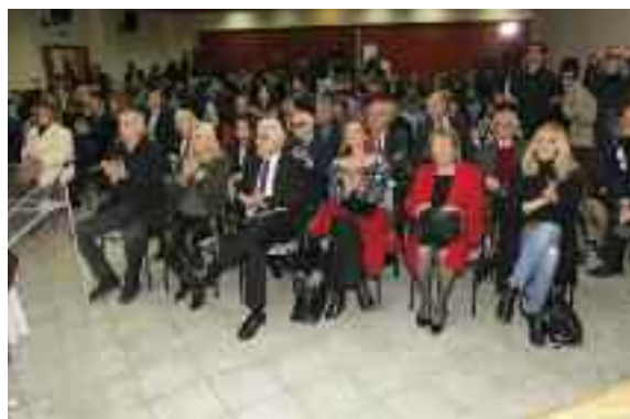
Εκπρόσωποι της πολιτικής και δικαστικής ηγεσίας της χώρας

Η χώρα μας είναι σε ένα σταυροδρόμι, προόδου και στασιμότητας. Τα χρόνια δοκιμασίας είναι πολλά και συνεχόμενα. Η κοινωνική ανασύνθεση ζητούμενη και οι αντοχές των πολιτών όλο και λιγοστεύουν.