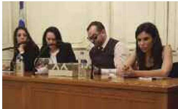
Στιγμιότυπα από την κοπή της πίτας 2018 του ΣΝΑΔΠ