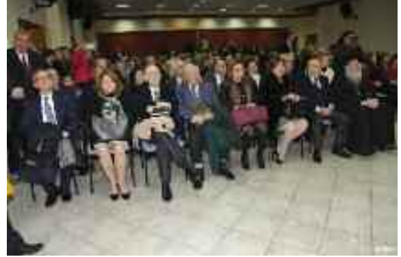
Κατάμεστη η αίθουσα της Ιωνιδείου Σχολής

συμμετοχή μας στις επιτροπές ασύλου, στις επιτροπές επίλυσης κτηματολογικών διαφορών αλλά και στις αρχαιρεσίες συνδικαλιστικών σωματείων.