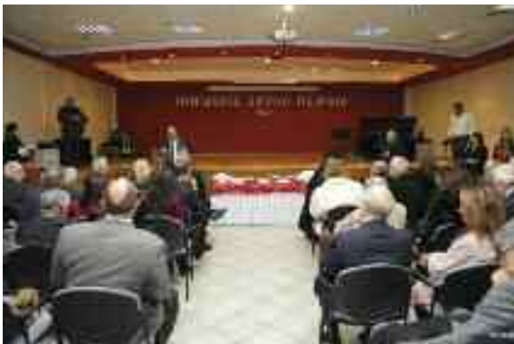
Αποψη της αίθουσας εκδηλώσεων της Ιωνιδείου Σχολής

Η επικαλούμενη από την πολιτική ηγεσία αποφόρτιση των δικαστηρίων δεν μπορεί να γίνει με εμβαλωματικές και αμφίβολης συνταγματικότητας διατάξεις είτε λέγονται έκδοση συναινετικών διαζυγίων από Συμβολαιογράφους είτε διαμεσολάβηση, αλλά απαιτούν την από κοινού αντιμετώπιση από όλη την εμπλεκόμενη νομική κοινότητα (δικαστές, δικηγόρους και γραμματείς).