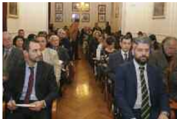
Άποψη της αίθουσας εκδηλώσεων του ΔΣΠ