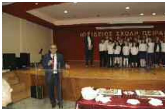
Η παιδική χορωδία του ΔΣΠ

Διατηρήσαμε μια ενιαία ασφαλιστική αντίληψη στην εκκαθάριση των υποθέσεων του Ταμείου Νομικών (επιστροφές παραβόλων προαγωγής, επίδομα μητρότητας, ρυθμίσεις υφιστάμενων ασφαλιστικών υποχρεώσεων, χωρίς προσαυξήσεις, παράταση ασφαλιστικών εισφορών του 2016 μέχρι 31.01.2018), παράλληλα διεκδικήσαμε και επιτύχαμε με αλληπάλληλες παραστάσεις στο Υπουργείο Κοινωνικής Ασφάλισης τη δυνατότητα δημιουργίας φορέα υποχρεωτικής Επικουρικής ασφάλισης εποπτευόμενο από την Ολομέλεια των Προέδρων των Δικηγορ, Συλλόγων της χώρας, με τη σύνταξη σχετικής αναλογιστικής