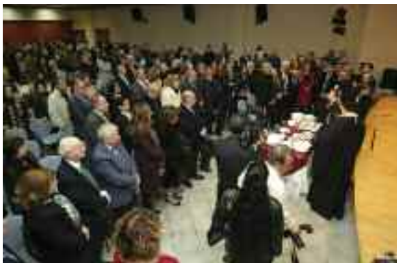
Αποψη της αίθουσας εκδηλώσεων της Ιωνιδείου Σχολής κατά την κοπή της πίτας

και όχι μόνον από τους εκδώσαντες τις κρινόμενες αποφάσεις, οι οποίοι στην συγκεκριμένη περίπτωση, ως υποκείμενοι οι ίδιοι σε κριτική, δεν είναι και οι πλέον αντικειμενικοί κριτές των κριτών του εαυτού των.