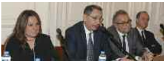
Το πάνελ των ομιλητών με τον Πρόεδρο του ΔΣΠ