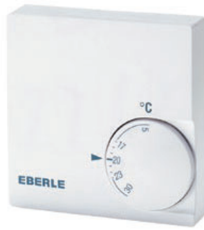
RTRt-E 525 80