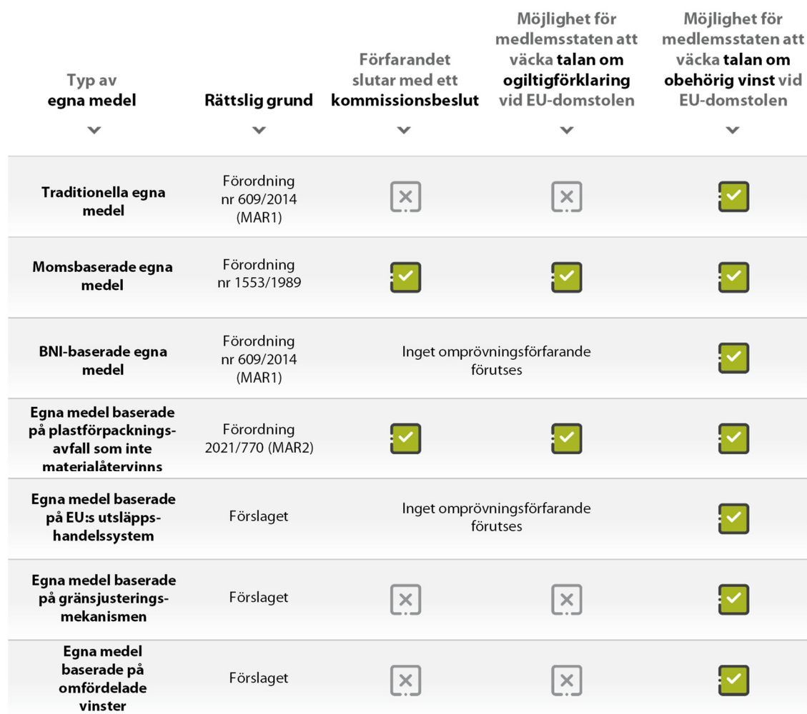
Tabell 2 – Jämförelse mellan förfarandena för omprövning avseende egna medel i befintliga rättsakter och i förslaget

Källa: Revisionsrätten, på grundval av rådets förordning (EU, Euratom) 2021/770, rådets förordning (EEG, Euratom) nr 1553/1989, rådets förordning (EU, Euratom) nr 609/2014 och förslaget.