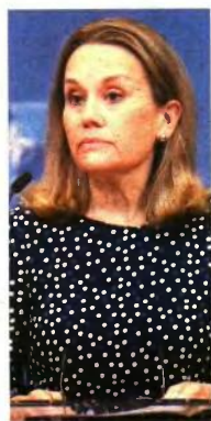
ΜΑΡΙΑΝΝΑ ΚΟΥΡΤΣΗ/ΑΝΤΩΝΗΣ ΛΕΓΟ

Ανατολική Ευρώπη. Το μεγάλο ερώτημα όμως είναι τι είδους παρουσία πιστεύει η Συμμαχία ότι θα χρειαστεί, σε μεσοπρόθεσμο και μακροπρόθεσμο επίπεδο, για να προσάψει την ασφάλεια όλων των μελών της. Έχετε ακούσει τον πρόεδρο Μπάιντεν να λέει ότι θα υπερασπιστούμε κάθε ίντσα της επικράτειας του NATO. Αυτό επί του οποίου τώρα δουλεύουμε είναι να καθορίσουμε τη μορφή αυτής της μελλοντικής δομής δινώμεων. Θα κοιτούσα πλέον προς τη Σύνοδο Κορυφής του προσεχούς Ιουνίου για περισσότερες ανακινώσεις, αλλά ως τότε οι στρατιωτικοί διοικητές μας θα εργαστούν πολύ σε αυτό το ζήτημα» εξηγεί. Υπάρχει πάντως ανησυχία