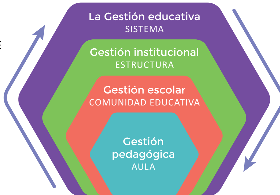
FIGURA 1. GESTIÓN EDUCATIVA Y SUS NIVELES DE CONCRECIÓN. SEP. (2010). Modelo de gestión educativa estratégica. México: SEPI. Página 57

En el desarrollo de la guía de estudio se definirán todos los tipos de gestión dentro del ámbito educativo, en lo que atañe a este apartado solo se profundizará en la gestión educativa y escolar.